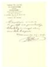
Verzoek huisarts (ERF010511-073)