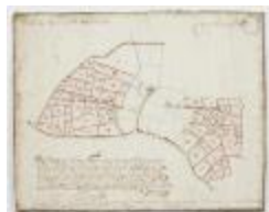
Figuratieve Caerte van de Cappeljau Thiende (K 473)