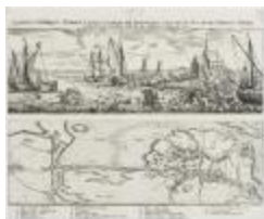
De Slag van Kallo (Liefkenshoek 2006.01.14)