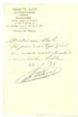
Verzoek huisarts (ERF010511-077)