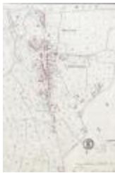
Kadastraal plan Belsele, detailopname dorpskern (SASN20120510_004)