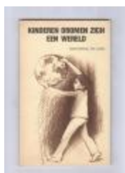
Anton Vlaskop in KINDEREN DROMEN ZICH EEN WERELD (PCAV15112014)