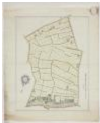
Wijkaart Bormtmeulenakker, Stekene (K 452)