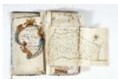
Kaartboek Stekene (KOKW Kaartboek Stekene Vergouwen)