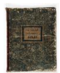
Plan Cadastral der Gemeente Sinay (KOKW Plan Cadastral Sinaai)