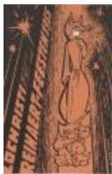
Programmabrochure Reijndersfeesten Lochristi (BWMA19_20101021_026)