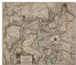
Detail uit Visscher, Nieuwe kaerte van 't Landt van Waes (K 291)