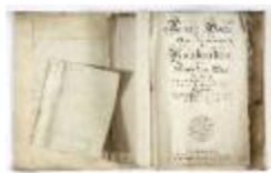
Kaartboek Nieuwkerken, met wijkkaarten, 1726 (SASN20120510_011)