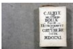
Landboek van Kruibeke (Landboek_Kruibeke)