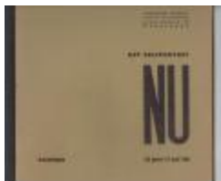
Het Zelfportret Nu : Samensteller en layout Anton Vlaskop (PCAV20121202_001)