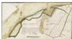
Caerten figurative van alle landen gelegen in Baesel ende Rupelmonde Broeck... (BWK&P_20110101_103)