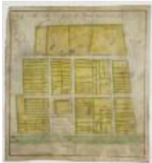
Kaart van Doeldorp (G51)