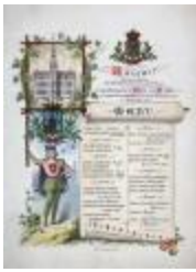
Menukaart inhuldiging nieuw stadhuis, 1 september 1878 (SASN20101119_008)