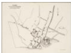
Fragment du plan de Rupelmonde (BWK&P_20110101_102)