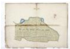
Perceelkaart Schausselbroeck Westeynde (209)