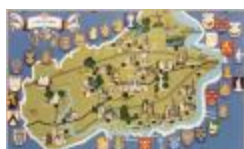
Toeristische kaart van het Waasland (BWK&P_20110101_061)