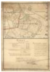
Polders van Kallo, Sint-Anna Ketenisse, Doel en Arenberg (Liefkenshoek A4)