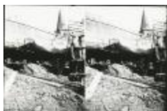
Scheepswerf Maes (9): arbeider aan boeg (GZ Tul093)