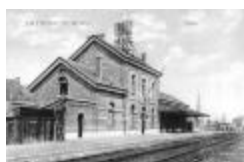
Spoorlijn 59 Antwerpen - Gent, station Zwijndrecht (SASN20110222_042)