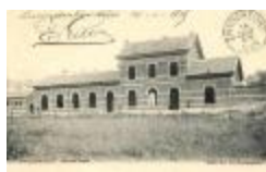
Spoorlijn 59 Antwerpen - Gent, station Zwijndrecht (SASN20110222_041)