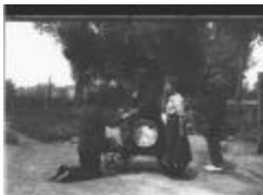
De drankkar (GZTul106)