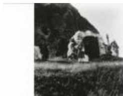
Kain en Abel: scène (GZTul011)