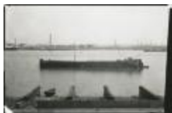
Scheepswerf Maes (6): boot op Schelde (GZ Tul089)