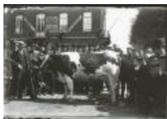
Veejaarmarkt in Burcht (GZTul100)