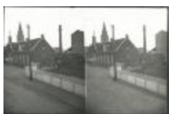
Kerkstraat Burcht: zicht op oud gemeentehuis (GZTul027)