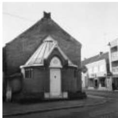
Kapel O. L. Vrouw, Burcht (WAS008000006_201)