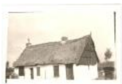
Huizeke juffrouw Verspecht (PCPZ20130521_038)