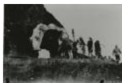
Kain en Abel (GZTul014)