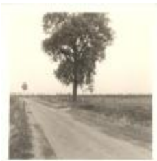
Kasseiweg in Melselepolder (PCPZ20141121_037)