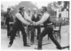
Dubbele handdruk (GZTul108)