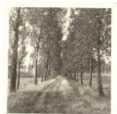
Dreef bij Blokkersdijk (PCPZ20141121_028)