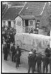
Historische Stoet (3): maquette oude boerderij (GZ Tul077)