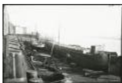
Scheepswerf Maes (8): boten op de werf (GZ Tul092)