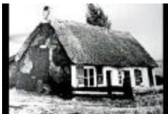
Kleuterhoefje Blokkendijk (PCAG20130206_03)