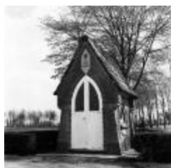
Kapel O. L. Vrouw, Zwijndrecht (WAS008000006_074)