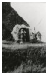
Kain en Abel (GZTuI008)