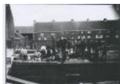
Scheepswerf Maes (15): personeel (GZ Tul099)