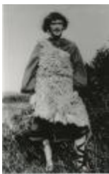
Close-up van Abel (GZTul009)