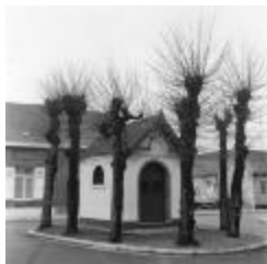
Kapel O. L. Vrouw, Zwijndrecht (WAS008000006_208)