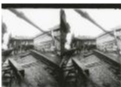
Scheepswerf Maes (1): arbeider (GZ Tul084)