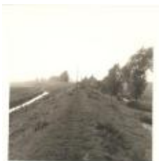
Dijk van Krankelooopolder (PCPZ20141121_033)