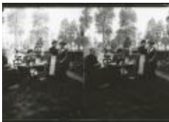
Burchtse Zelfstandigen (5): paspop (GZ Tul083)