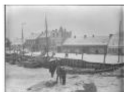
Ijsgang op de Schelde (3): mannen op dichtgevroren Schelde (GZTul 103)