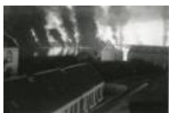
Brand op de Schelde (3): rechterover (GZTUL025)