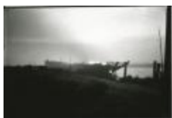
Brand van de Schelde (1) (GZ Tul023)