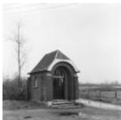
Kapel van de H. Moeder Anna, Zwijndrecht (WAS008000006_209)