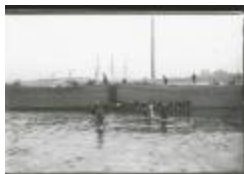
Scheepswerf Maes (7): spelende kinderen (GZ Tul090)