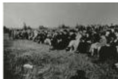
Publiek bij openluchtvoorstelling (GZtuI006)