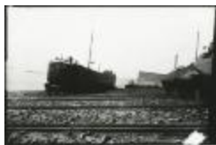
Scheepswerf Maes (11): schip te water gelaten (GZ Tul095)