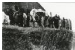
Openluchttheater (Kain en Abel?) (GZtuI007)