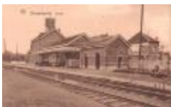
Prentkaart Spoorlijn 59 station Zwijndrecht (PCMC20120323_011)