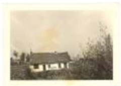
Huizeke Juffrouw Verspecht (PCPZ20130521_041)