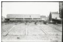
Scheepswerf Maes (3): Scheepswerf frontaal zicht (GZ Tul086)