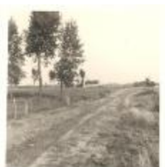
Woningen bij de Blokkersdijk (PCPZ20141121_031)