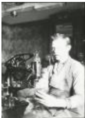
Burchtse Zelfstandigen (2): schoenmaker (GZ Tul079)