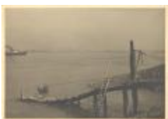
Steigertje bij Krankeloon bij eb (PCPZ20141121_002)