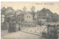
Prentkaart Spoorlijn 59 station Zwijndrecht+ overweg (PCMC20120426_001)