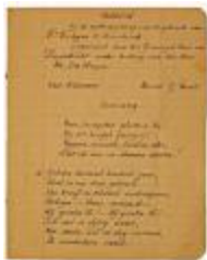
Huldelielid uitgevoerd door het gemengd koor van Zwijndrecht (8)