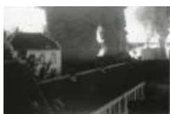
Brand van de Schelde (2): Burchtse daken (GZTul024)