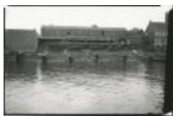
Scheepswerf Maes (10): zicht op de Schelde (GZ Tul094)