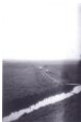
Melselepolder vanaan Krankeloon (PCPZ20141121_035)