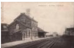
Prentkaart Spoorlijn 59 station Zwijndrecht (PCMC20120426_002)