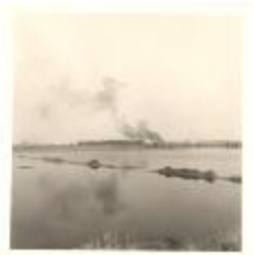
Pijp Toebak (PCPZ20141121_030)