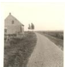
Café Polderzicht in Melselepolder (PCPZ20141121_036)