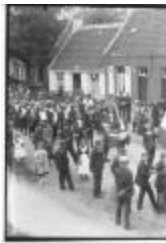
Historische Stoet (2): grosse-caise (GZ TUL076)