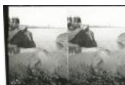
Dijkdoorbraak bij De Schelde (GZTul015)