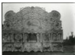
Orgel Gavioli et Cie 3 (GZTul022)