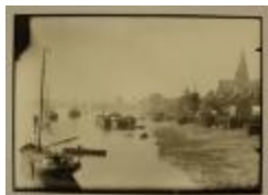
Laag tij aan de Schelde (Burcht) (ZCD001000039)