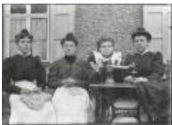
Burchtse Zelfstandigen (1): naaisters (GZ Tul078)