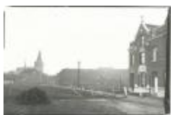
Pastoor Coplaan, Burcht (GZTul026)