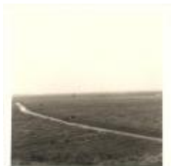
Boerveldse beek in de Melselepolder (PCPZ20141121_026)