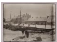
Winter aan de kaai (Burcht) (ZCD001000037)