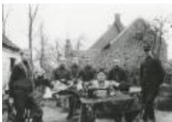
Burchtse Zelfstandigen (3): naaister in open lucht (GZ Tul080)