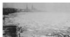
Ijsgang op de Schelde (1): zicht op dichtgevroren Schelde (GZTul 101)