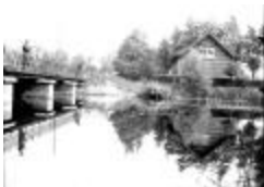
Soldaten oefeningen (15): brug en paviljoen (GZTul164)