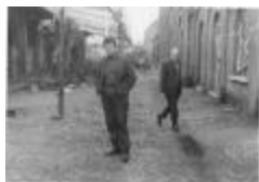
Opbouw bloemenstoet 1969 (cdu06012040)