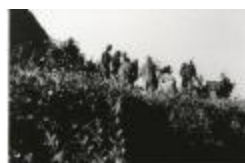
Malpertus / Vos Reinaert (GZTul013)