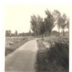
Polder bij Blokkersdijk (PCPZ20141121_027)