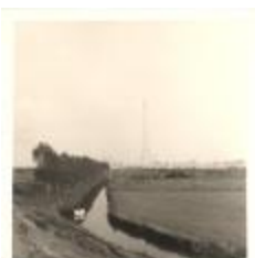
Dijkgracht bij Krankelooopolder (PCPZ20141121_034)