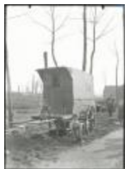
Kinderen bij kar: Burcht (GZTuI001)