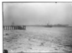
Ijsgang op de Schelde (2): aanlegsteiger (GZTul 102)