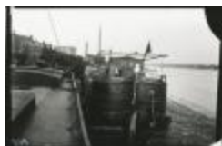
Scheepswerf Maes (13): schip op werf (GZ Tul097)