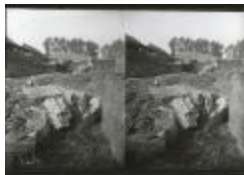
Scheepswerf Maes (2): boot (GZ Tul085)