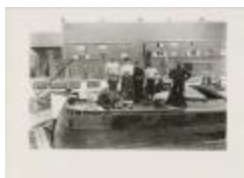
Scheepswerf Maes (14): mannen en vrouwen op dek (GZ Tul098)