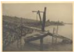
Steigertje bij scheldedijk aan Krankeloon (PCPZ20141121_001)