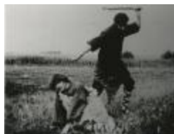
Kain en Abel: de broedermoord (GZTul010)