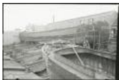
Scheepswerf Maes (7): boten op werf zij-aanzicht (GZ Tul091)