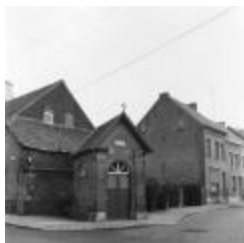
Kapel O. L. Vrouw, Zwijndrecht (WAS008000006_210)