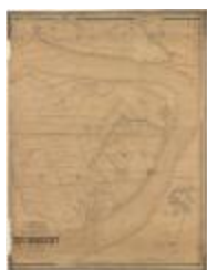
Popp-kaart: Zwijndrecht (Zwijndrecht_Popp A4)