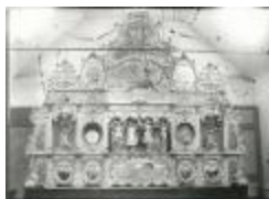
Orgel gavioli et Cie (GZTul019)