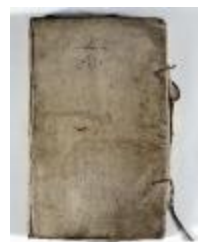
Kaartboek Sint-Pauwels (KOKW Kaartboek Sint-Pauwels Maes)