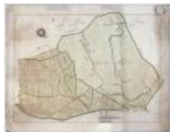
Wijkkaart Stekene: Hellestraat-Kapellebrug (K 463)