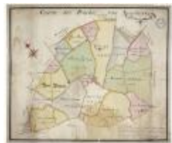
Caerte der prochie van Nieuwerkercken (BWK&P_20120415_114)