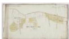
Figuratieve Caerte van de Cabbeljau Thiende (K 474)