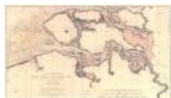
Carte réduite des cotes des Pays-Bas (Côtes des Pays-Bas A4)