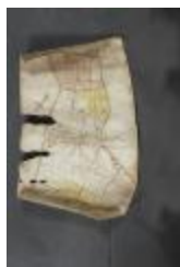
Uittreksel uit ongekend kaartboek van de regio Beveren (_88D9685 kopie)