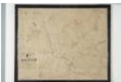
Popp-kaart: Kadasterplan van de gemeente Daknam (1619bis)