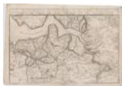
Les environs d'Anvers, d'Hulst, d'Axel, de Santvliet, de Lillo, de Saint-Nicolas et du Sas de Gand (Danet)