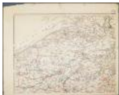
Het graafschap Vlaanderen (BWK&P_20110101_109)