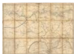
Vandermaelen: Lokeren en Dendermonde (Lokeren_Termonde A4)