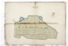
Perceelkaart Schausselbroeck Westeynde (209)