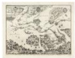
Het beleg der stadt Antwerpen (BWK&P_20120415_115)