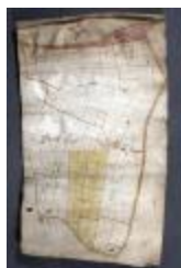
Uittreksel uit ongekend kaartboek van Haasdonk (_88D9694 kopie)