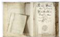
Kaartboek Nieuwkerken, met wijkkaarten, 1726 (SASN20120510_011)