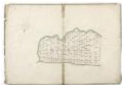
Perceelkaart Schausselbroeck Oosteynde (210)