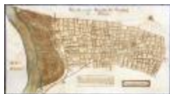
Figuratieve kaart van de heerlijkheid van Cauwerburgh (GAT20120521_001)