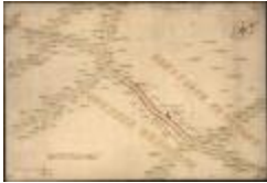
Oorlogskaart: Stekene (Stekene_dorp A4 248/257)