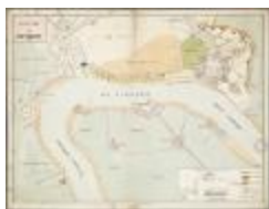
Positie van Antwerpen (BWK&P_20110101_098)