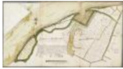
Caerten figurative van alle landen gelegen in Baesel ende Rupelmonde Broeck... (BWK&P_20110101_103)