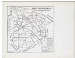
Wijken van Sint-Niklaas naar de oude kaart van Semeelen (BWK&P_20110101_106)