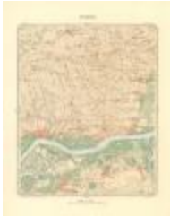
Dépot de la Guerre: Tamise (Tamise A4 227/257)