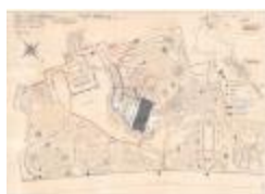
Reynaertspel 1985, technisch plan stadspark (SASN20110512_049)