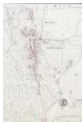
Kadastraal plan Belsele, detailopname dorpskern (SASN20120510_004)