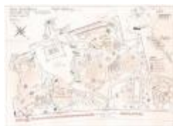
Reynaertspel 1992, technisch plan stadspark (SASN20110512_050)