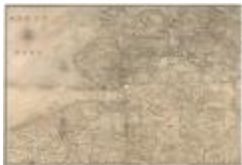
Kaart van Zeeland en de Scheldemonding (Zelande_Escaut A4)