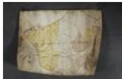
Uittreksel uit een ongekend kaartboek van Haasdonk (_88D9690 kopie)