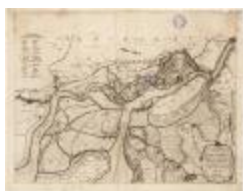
Popp-kaart: Plan parcellaire de la commune de Elversele avec les mutations (BWK&P_20110101_101)