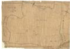
Kadastrale kaart van Beveren (Beveren_SectionD_3eFeuille)