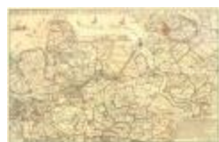
W.T. Hattinga, de Schelde bij Lillo en naast aangelegen landen (Lillo_Hattinga A4)