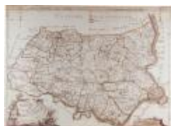
J.B. de Bouge, Carte Topographique du Pays de Waes (K 373)