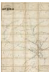
Popp-kaart: Kadastraal plan Sint-Niklaas, Popp 1/5000 (SASN20120510_007)