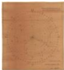
Oriëntering vanop de toren van Temse (Oriëntering_toren_Temsche A4)