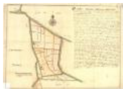
Perceelkaart van de regio Arenbergpolder (K 588)