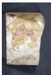
Uittreksel uit ongekend kaartboek van Haasdonk (_88D9692 kopie)