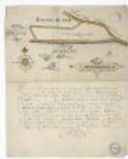
Kaart van een schor nabij Bazel (BWK&P_20120421_135)