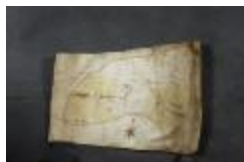
Uittreksel uit ongekend kaartboek van Haasdonk (_88D9691 kopie)