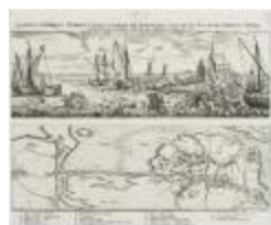
De Slag van Kallo (Liefkenshoek 2006.01.14)