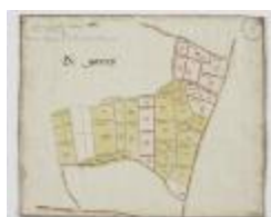
Wijkkaart van Haasdonk, omgeving De Gavers (K 478)