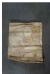
Uittreksel uit ongekend kaartboek van Haasdonk (_88D9686 kopie)