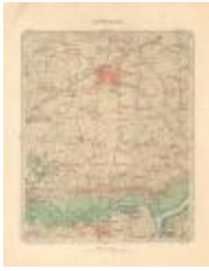
Dépot de la Guerre, Saint-Nicolas (St-Nicolas A4)