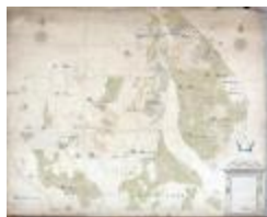
Kaart van heerlijkheden het Beverse, Puiembeke, Paddeschoot en Aarschot te Sint-Niklaas, 1786 (SASN20120510_010)