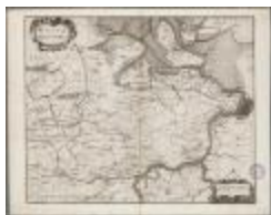
Wasia - 't Land van Waes (BWK&P_20110101_093)