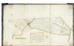
Caertien figuratief van de hooghe landen opde Waessche Clinghe (BWK&P_20110101_100)