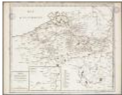
Carte du Hainault, Flandre, Brabant, Luxembourg et Païs de Limbourg (BWK&P_20110101_107)