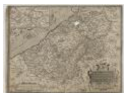
Ortelius, Kaart van Vlaanderen (K 559)