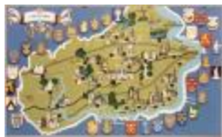
Toeristische kaart van het Waasland (BWK&P_20110101_061)