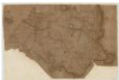
Fricx, Carte très particulière du Pays de Waes (Tres particuliere)