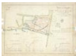
Kasteel van Temsche (BWK&P_20120417_117)