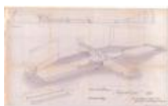
Reynaertspel 1973, technisch plan podium Grote Markt (SASN20110512_048)