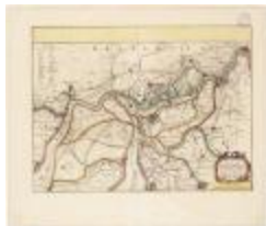
Tabula castelli ad Santflitam,... (BWK&P_20110101_096)