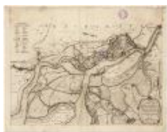
Tabula castelli ad Santflitam,... (BWK&P_20110101_095)