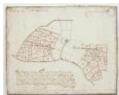
Figuratieve Caerte van de Cabbeljau Thiende (K 473)