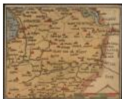
De Charte van Vlaenderen (Het Land van Waas_Heyns A4)