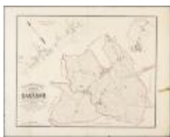
Popp-kaart: Plan parcellaire de la commune de Dacknam avec les mutations (BWK&P_20110101_099)