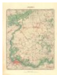
Dépot de la Guerre: Lokeren (Lokeren A4)