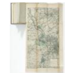
Springtij van 1906 in het Scheldebekken (BWK&P_20120421_121)