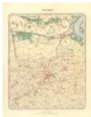
Dépot de la Guerre: Beveren (Beveren A4)