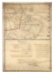
Polders van Kallo, Sint-Anna Ketenisse, Doel en Arenberg (Liefkenshoek A4)