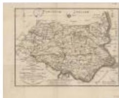
Overzichtskaart van district Sint-Niklaas (K 471)