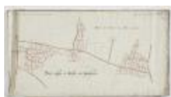
Wijkkaart regio Haasdonk (Zandstraat) en Melsele (K 477)