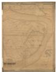
Popp-kaart: Zwijndrecht (Zwijndrecht_Popp A4)