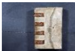
Landboek van Melsele (GAB20122522_001)