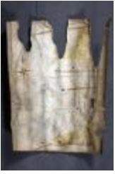
Uittreksel uit ongekend kaartboek van Haasdonk (_88D9696 kopie)