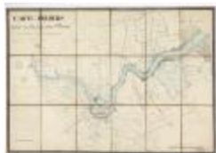
Carte des Polders (BWK&P_20110101_97)