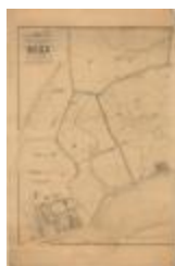
Popp-kaart: Atlas cadastral de Belgique - Commune de DOEL (Doel_Popp A4)