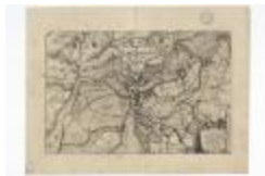
Caerte van 't Scheldt ende Santvliet (BWK&P_20120417_116)