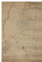
Figuratieve kaart Vrasene, 1767 (SASN20120510_009)