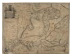
Description de Santvliet, la Rivière Schelde et Pais de Hulst (Santvliet-Hulst A4 253/257)