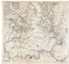
Caerte figurative van 't lant van Waes ende Hulster Ambacht (BWK&P_20120415_113)