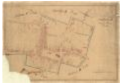
Kadastrale kaart van Beveren (Beveren_SectionD_8eFeuille)