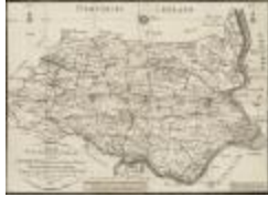
Nieuwe plaatsbeschrijfkundige kaart van het distrikt Sint-Nikolaas voorheen Land van Waas (BWK&P_20110101_112)