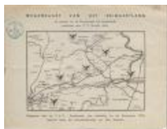
Wegenkaart van het Reinaertland (BWMAP19_20101021_021)