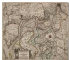
Detail uit Visscher, Nieuwe kaerte van 't Landt van Waes (K 291)