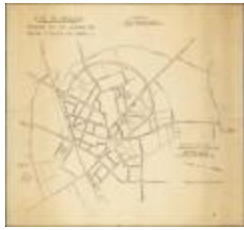
Stad Sint-Niklaas: ontwerp tot het openen van nieuwe straten en lanen (BWK&P_20110101_104)