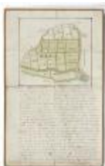
Perceelkaart Meulenbroeck (210bis)