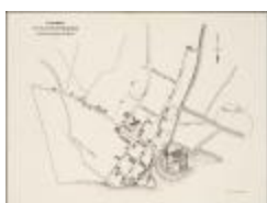
Fragment du plan de Rupelmonde (BWK&P_20110101_102)