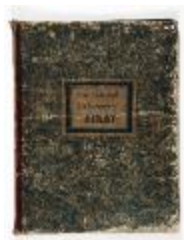
Plan Cadastral der Gemeente Sinay (KOKW Plan Cadastral Sinaai)