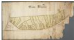
Grooten Clooserlant (BWK&P_20110101_105)