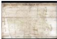
Figuratieve kaart van Elversele, 1716 (_88D5734 kopie)