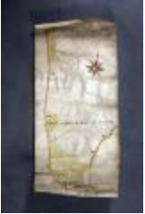
Uittreksel uit ongekend kaartboek van Haasdonk (_88D9698 kopie)