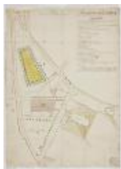
De markt en het centrum van Sint-Niklaas (K 508)