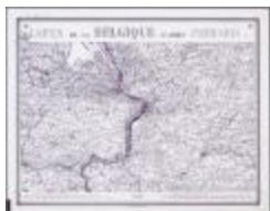
Carte de Belgique d'après Ferraris (BWK&P_20110101_108)