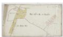
Wijkkaart van Haadonk, omgeving Ropstraat en Bergstraat (K 476)