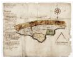
Polderkaart: Aanwassen verloren Cost 1659 (212bisb)