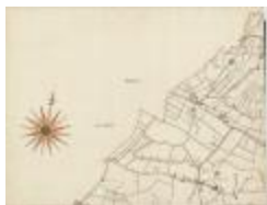
Kaerte figurative van het land van Waes (BWK&P_20110101_091)