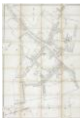
Popp-kaart: Kadastraal plan Sint-Niklaas, Popp 1/2500 (SASN20120510_008)