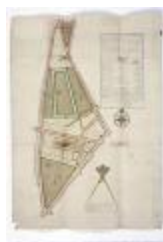
Figuratieve kaart markt Sint-Niklaas, 1765 (SASN20120510_002)