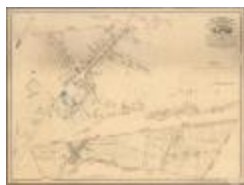
Popp-kaart: Clinge (Clinge_Popp A4)