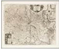
Flandria partes duae quarum altera proprietaria altera imperialis vulgo dicitur (BWK&P_20110101_111)