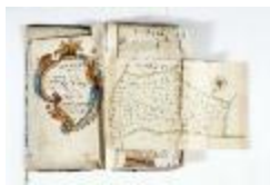
Kaartboek Stekene (KOKW Kaartboek Stekene Vergouwen)