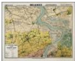
Type du pays de Waes et des polders de l'Escaut (BWK&P_20110101_092)