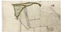
Vierden brouckwijck (Bazel) (BWK&P_20120417_002)