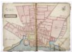
Dorp Temse met dorpsnummers (192)