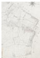
Kadastraal plan Sinaai, detailopname dorpskern (SASN20120510_006)