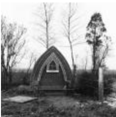
Muurkapel, Polderstraat Meerdonk (WAS008000006_093)