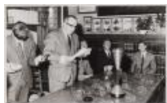
Schutters, liggende wip (WAS006000001_075)