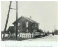
Spoorweg Shondstraat, Station Sint-Pauwels (HKDKSP20110214-06)