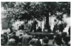
Kajotsters 1950 (HKDKSP20110827_001)