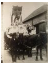
Stoet 1899, Congregatie (HSG001000076)