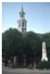
Sint-Corneliuskerk in Meerdonk (PCJM20120923_004)