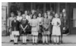
Vrije basisschool 1946