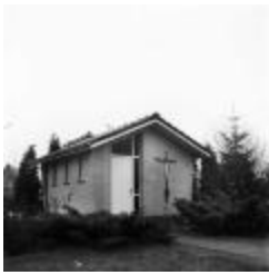
Kapel H.Kruis, Oude Molenstraat De Klinge (WAS008000006_094)