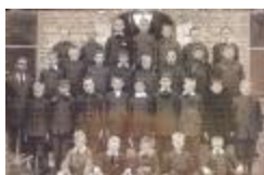
Gemeenteschool 1922 (HDKSP20100110-007)