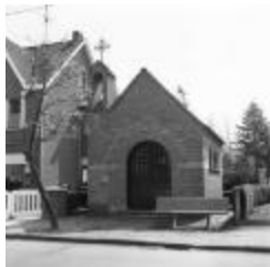
Kapel, Mr Bermijnstraat Sint Pauwels (WAS008000006_152)