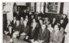
Schutters, liggende wip (WAS006000001_076)