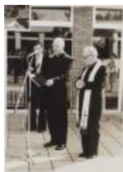
Gemeenteschool Inwijdingsplechtigheid (HKDKSP20120105-023)