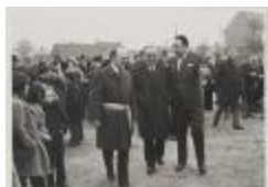
Gemeenteschool Eerste steenlegging 1973 (HKDKSP20120105-011)