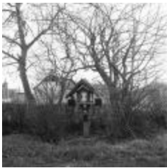
Kapelkje O. L. Vrouw, Baarstraat Sint Gillis (WAS008000006_142)