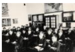
Gemeenteschool 1945 (HDKSP20100110-015)