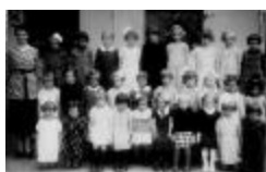
Vrije basisschool 1938