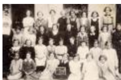
Vrije basisschool 1938 (HDKSP20100110-405)