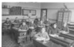
Gemeenteschool 1952 (HDKSP20100110-030)