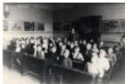
Vrije basisschool kleuterklas 1944 (HDKSP20100110-210)