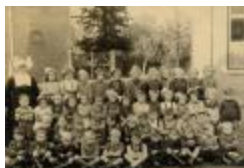
Vrije basisschool kleuterklas 1952 (HDKSP20100110-214)