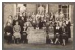
Meesteressen der zondagschool (HSG001000085)