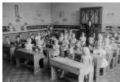
Vrije basisschool kleuterklas 1958 (HDKSP20100110-216)