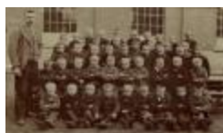
Gemeenteschool 1898 (HDKSP20100110-001)

Het regent, het regent. De pannekes worden nat (4346)