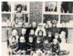
Vrije basisschool kleuterklas 1960 (HDKSP20100110-218)