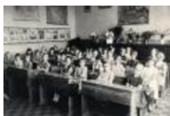
Vrije basisschool 1958 (HDKSP20100110-416)