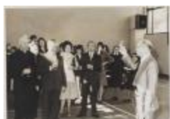
Gemeenteschool Inwijdingsplechtigheid (HKDKSP20120105-017)