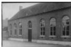
Kleuterschool van de Vrije meisjesschool (kleuterschool)