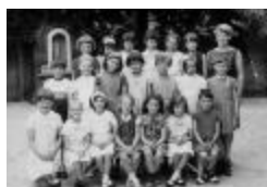
Vrije basisschool 1965 (HDKSP20100110-428)