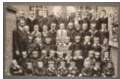
Tweede leerjaar (HSG001000086)