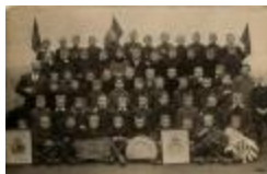
Gemeenteschool 1919 (HDKSP20100110-005)