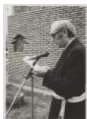
Gemeenteschool Eerste steenlegging 1973 (HKDKSP20120105-008)