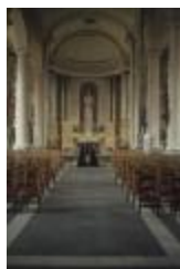
Interieur van Sint-Corneliuskerk in Meerdonk (PCJM20120923_006)