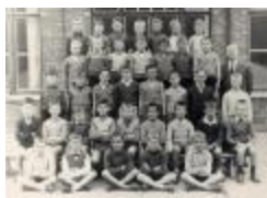
Gemeenteschool 1961 (HDKSP20100110-038)