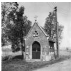
Kapel Sint-Jozef, Pastorijstraat Sint Pauwels (WAS008000006_156)