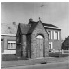
Kapel Heilig Hart van Jezus, Lijkveldestraat Sint Pauwels (WAS008000006_157)