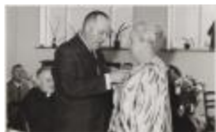
Vrije basisschool, personeel, pensionering (WAS006000002_012)