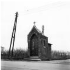
Kapel van O.L.vrouw, Meerdonk (WAS008000006_087)