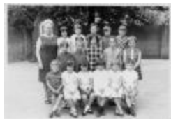
Vrije basisschool 1965 (HDKSP20100110-427)