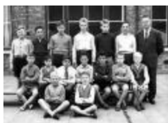
Gemeenteschool 1961 (HDKSP20100110-039)