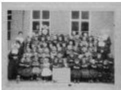
Vrije basisschool kleuterklas 1903 (HDKSP20100110-201)