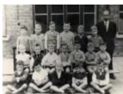
Gemeenteschool 1961 (HDKSP20100110-037)