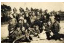
Gemeenteschool 1931 (HDKSP20100110-008)