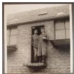
Sport, Duivenmelkers (HSG001000011)