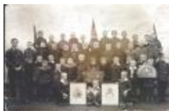
Gemeenteschool 1919 (HDKSP20100110-004)