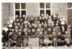
Vrije basisschool 1903 (HDKSP20100110-401)