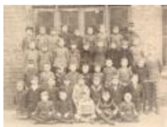
Gemeenteschool 1932 (HDKSP20100110-009)