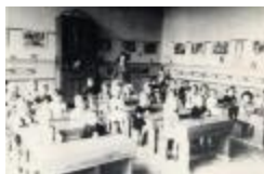
Vrije basisschool kleuterklas 1944 (HDKSP20100110-211)