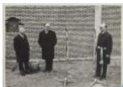
Gemeenteschool Eerste steenlegging 1973 (HKDKSP20120105-006)