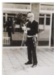
Gemeenteschool Inwijdingsplechtigheid (HKDKSP20120105-025)