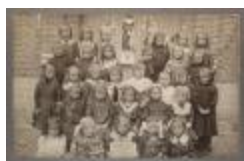
Bewaarschool Sint-Gillis-Waas (HSG001000091)