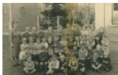
Vrije basisschool kleuterklas 1952 (HDKSP20100110-213)