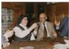
Jubileum Kloosterjubileum (WAS006000003_028)