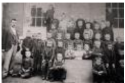
Gemeenteschool 1903 tweede klas (HKDKSP20120105-001)