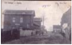
Station De Klinge (zijaanzicht) (HKDKDK20110404_007)