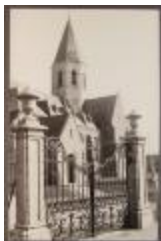
Kerk, Kerkhek (HSG001000034)