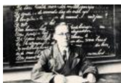
Gemeenteschool personeel 1944 (HDKSP20100110-018)