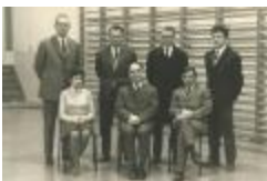
Gemeentelijke Jongensschool - Schoolteam 1969-1970 (HSG002000001)