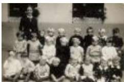
Vrije basisschool kleuterklas 1938 (HDKSP20100110-205)