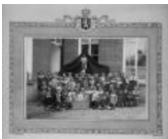
Vrije basisschool kleuterklas 1920 (HDKSP20100110-204)