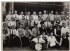
Schuttersgilde Sint-Sebastiaan Sint-Pauwels (WAS006000004_106)