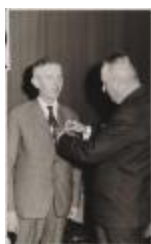
Gemeenteschool eretekens 1970 06 30