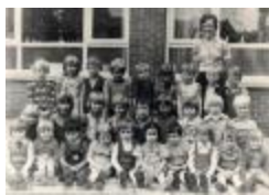
Vrije basisschool kleuterklas 1961 (HDKSP20100110-220)