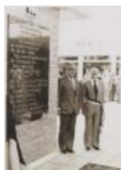
Gemeenteschool Inwijdingsplechtigheid (HKDKSP20120105-028)