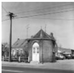
Kapel van de Heilige Antonius, Zandstraat Sint Pauwels (WAS008000006_158)