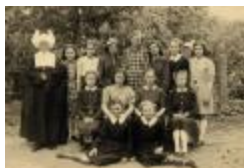
Vrije basisschool 1945 (HDKSP20100110-406)