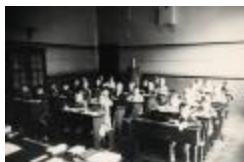
Gemeenteschool 1955 (HDKSP20100110-031)