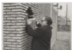
Gemeenteschool Eerste steenlegging 1973 (HKDKSP20120105-012)