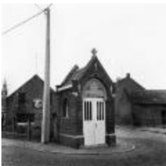
Kapel van de H. Cornelius, Meerdonk (WAS008000006_092)