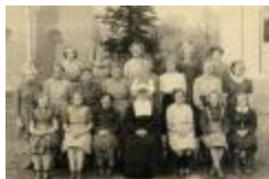
Vrije basisschool 1953 (HDKSP20100110-411)