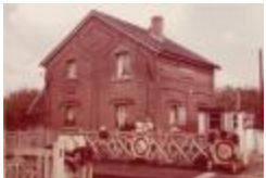
Spoorweg Shondstraat, Station Sint-Pauwels (HKDKSP20110214-05)