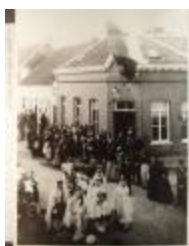
Stoet 1899, Congregatie (HSG001000078)