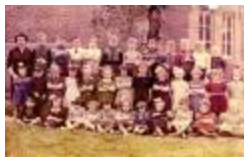
Vrije basisschool kleuterklas 1955 (HDKSP20100110-215)