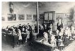
Vrije basisschool kleuterklas 1945 (HDKSP20100110-212)