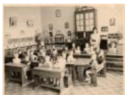
Vrije basisschool kleuterklas 1960 (HDKSP20100110-219)