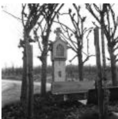
Kapel "Twistkapelletjes", Grouwesteenstraat Sint Pauwels - Kemzeke (WAS008000006_145)