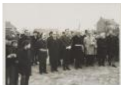
Gemeenteschool Eerste steenlegging 1973 (HKDKSP20120105-009)