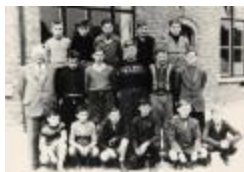
Gemeenteschool 1956 (HDKSP20100110-035)