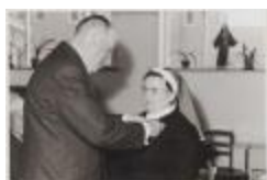
Vrije basisschool personeel, Pensionering (WAS006000002_011)