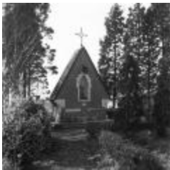
Muurkapel, Sint-Niklaasstraat Sint Gillis (WAS008000006_103)