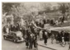
Communie Eerste (HKDKSP20171120_054)