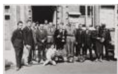
Schutters, liggende wip (WAS006000001_077)