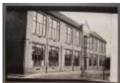
Vrije basisschool, Meisjesschool (HSG001000058)