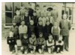
Gemeenteschool 1956 (HDKSP20100110-033)