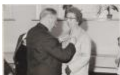
Vrije basisschool personeel, Pensionering (WAS006000002_013)