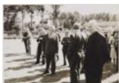
Gemeenteschool Inwijdingsplechtigheid (HKDKSP20120105-014)