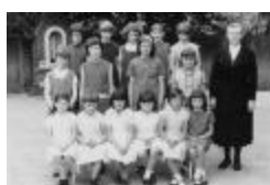
Vrije basisschool 1965 (HDKSP20100110-429)