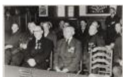
Eretekens 11 11 1965 (WAS006000001_032)