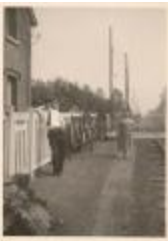
Spoorweg Shondstraat, Station Sint-Pauwels (HKDKSP20110214-04)