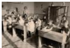
Vrije basisschool 1965 (HDKSP20100110-424)