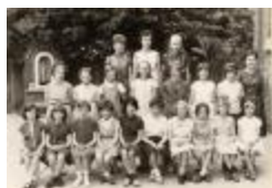
Vrije basisschool 1965 (HDKSP20100110-431)