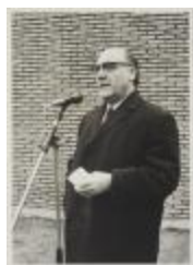
Gemeenteschool Eerste steenlegging 1973 (HKDKSP20120105-007)