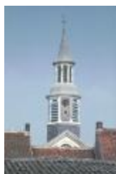
Sint-Corneliuskerk, Meerdonk (PCJM20120923_005)