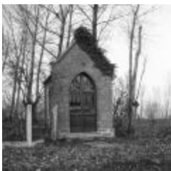
Kapel van O. L. Vrouw van Vrede, Shondstraat Sint Pauwels (WAS008000006_147)