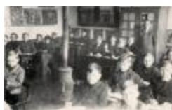
Gemeenteschool 1941 (HDKSP20100110-013)