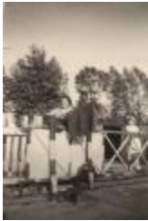
Spoorweg Shondstraat, Station Sint-Pauwels (HKDKSP20110214-03)