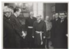
Gemeenteschool Eerste steenlegging 1973 (HKDKSP20120105-010)