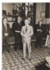
Gemeenteschool Inwijdingsplechtigheid (HKDKSP20120105-018)