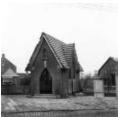
Kapel, Meerdonk (WAS008000006_090)