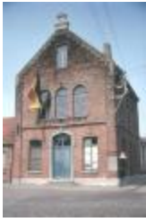
Gemeentehuis van Meerdonk (PCJM20120923_007)