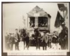
Stoet 1899, Congregatie (HSG001000072)