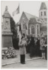
Eretekens 11 11 1974 (HSG001000527)