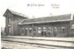
Spoorlijn 57A Sint-Gillis-Waas - Moerbeke, station Sint-Gillis-Waas (SASN20110222_027)