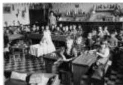
Vrije basisschool kleuterklas 1964 (HDKSP20100110-228)