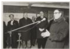
Gemeenteschool Eerste steenlegging 1973 (HKDKSP20120105-004)