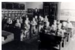
Gemeenteschool 1948 (HDKSP20100110-023)