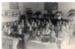
Vrije basisschool 1953 (HDKSP20100110-413)