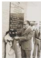
Gemeenteschool Inwijdingsplechtigheid (HKDKSP20120105-027)