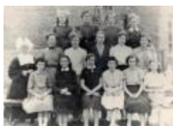
Vrije basisschool 1955 (HDKSP20100110-415)