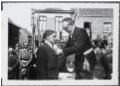
Eretekens 1950 oud-strijders (HSG00100127)