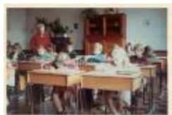
Vrije basisschool 1968 (HDKSP20100110-418)