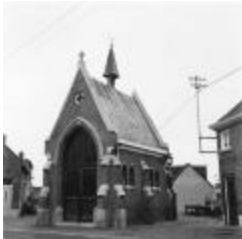
Kapel van Onze-Lieve-Vrouw van VII Weeën, Kapelstraat De Klinge (WAS008000006_095)