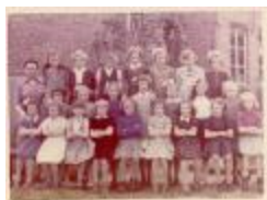
Vrije basisschool 1954 (HDKSP20100110-414)