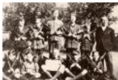
Gemeenteschool 1930 (HDKSP20100110-003)