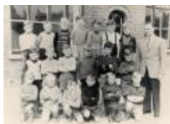
Gemeenteschool 1956 (HDKSP20100110-032)