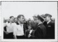
Ontvangst Brigade Luchtmacht van Sint-Niklaas (HSG00100156)