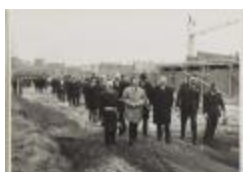
Gemeenteschool Eerste steenlegging 1973 (HKDKSP20120105-005)