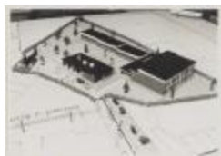
Gemeenteschool Eerste steenlegging 1973