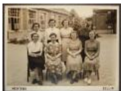
Vrije school Sint-Gillis-Waas (HSG001000079)