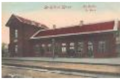
Station Sint-Gillis-Waas (SASN20110222_011)