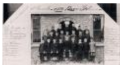
Gemeenteschool 1922