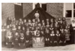
Vrije basisschool 1920 (HDKSP20100110-403)