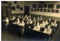
Gemeenteschool 1947 (HDKSP20100110-019)