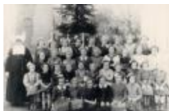
Vrije basisschool 1952 (HDKSP20100110-410)