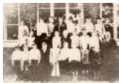
Gemeenteschool 1937 (HDKSP20100110-011)