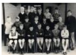
Gemeenteschool 1967 (HDKSP20100110-042)