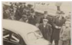
Communie Eerste (HKDKSP20171120-057)