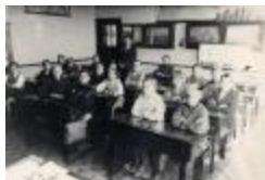
Gemeenteschool 1948 (HDKSP20100110-025)