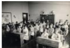
Vrije basisschool 1964 (HDKSP20100110-425)