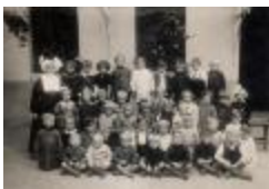
Vrije basisschool kleuterklas 1938 (HDKSP20100110-206)