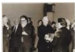
Gemeenteschool Inwijdingsplechtigheid (HKDKSP20120105-016)