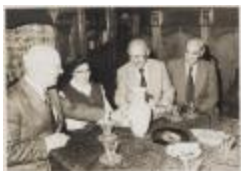
Jubileum Kloosterjubileum (WAS006000003_029)