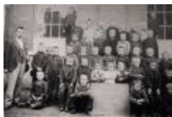
Gemeenteschool 1903 (HDKSP20100110-002)