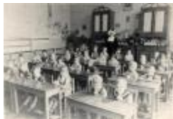
Vrije basisschool kleuterklas 1958 (HDKSP20100110-217)