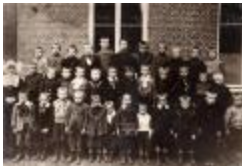
Vrije basisschool kleuterklas 1904 (HDKSP20100110-202)