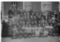
Vrije basisschool kleuterklas 1905 (HDKSP20100110-203)