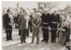
Gemeenteschool Inwijdingsplechtigheid (HKDKSP20120105-022)