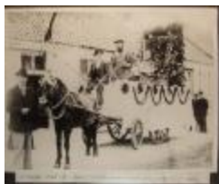
Stoet 1899, Congregatie (HSG001000071)