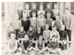
Gemeenteschool 1961 (HDKSP20100110-040)