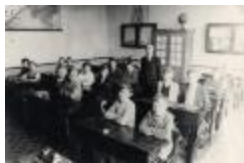
Gemeenteschool 1948 (HDKSP20100110-024)