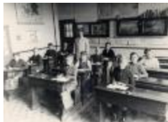
Gemeenteschool 1950 (HDKSP20100110-027)