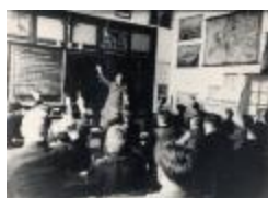
Gemeenteschool 1944 (HDKSP20100110-017)