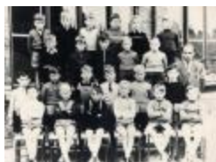
Gemeenteschool 1957 (HDKSP20100110-036)