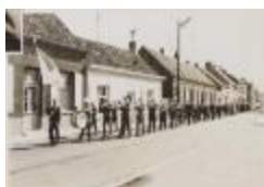
Gemeenteschool Inwijdingsplechtigheid (HKDKSP20120105-019)