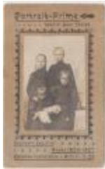
Kinderen D'Hooghe (PCVDB20140811_002)