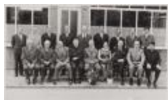
Gemeenteschool eretekens 1970 06 30 (HKDKSP20120105-031)