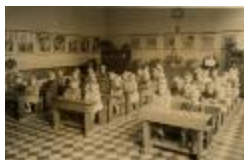
Meisjesschool De Klinge (klas)