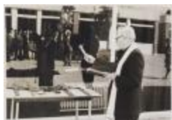
Gemeenteschool Inwijdingsplechtigheid (HKDKSP20120105-024)