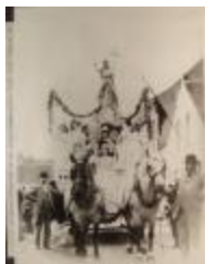
Stoet 1899, Congregatie (HSG001000075)