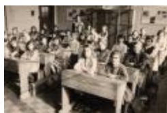
Vrije basisschool 1964 (HDKSP20100110-426)