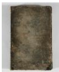
Kaartboek Sint-Gillis-Waas (KOKW Kaartboek Sint-Gillis-Waas Du Caju)