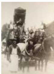
Stoet 1899, Congregatie (HSG001000073)