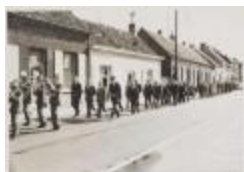
Gemeenteschool Inwijdingsplechtigheid (HKDKSP20120105-020)