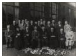
Gemeenteschool eretekens 1948 27 september (HKDKSP20120105-029)