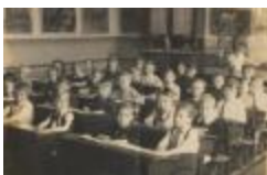
Vrije basisschool kleuterklas 1938 (HDKSP20100110-207)