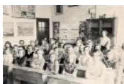
Vrije basisschool 1951 (HDKSP20100110-408)