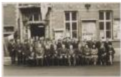
Eretekens 11 11 1970 (WAS006000002_030)