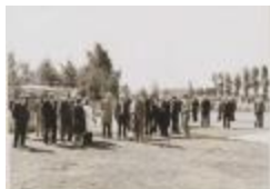
Gemeenteschool Inwijdingsplechtigheid (HKDKSP20120105-013)