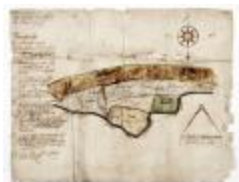
Polderkaart: Aanwassen verloren Cost 1659 (212bisb)