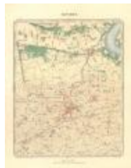
Dépot de la Guerre: Beveren (Beveren A4)