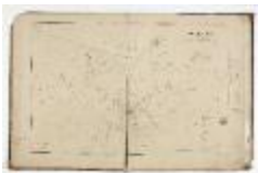
Kadastrale atlas Belsele, 1856 (SASN20120510_003)