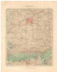
Dépot de la Guerre, Saint-Nicolas (St-Nicolas A4)