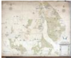
Kaart van heerlijkheden het Beverse, Puiembeke, Paddeschoot en Aarschot te Sint-Niklaas, 1786 (SASN20120510_010)