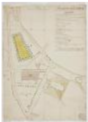
De markt en het centrum van Sint-Niklaas (K 508)