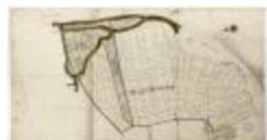
Vierden brouckwijck (Bazel) (BWK&P_20120417_002)