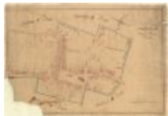
Kadastrale kaart van Beveren (Beveren_SectionD_8eFeuille)