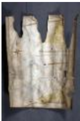
Uittreksel uit ongekend kaartboek van Haasdonk (_88D9696 kopie)