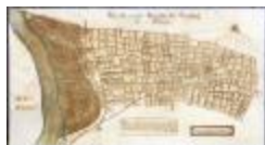
Figuratieve kaart van de heerlijkheid van Cauwerburgh (GAT20120521_001)