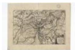
Caerte van 't Scheldt ende Santvliet (BWK&P_20120417_116)