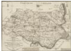
Nieuwe plaatsbeschrijfkundige kaart van het distrikt Sint-Nikolaas voorheen Land van Waas (BWK&P_20110101_112)