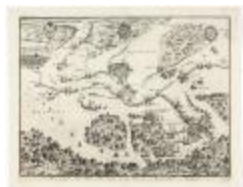
Het beleg der stadt Antwerpen (BWK&P_20120415_115)