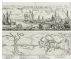
De Slag van Kallo (Liefkenshoek 2006.01.14)