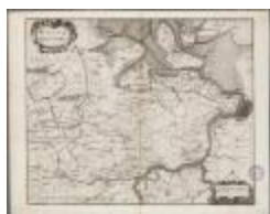
Wasia - 't Land van Waes (BWK&P_20110101_093)