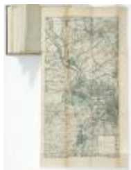
Springtij van 1906 in het Scheldebekken (BWK&P_20120421_121)