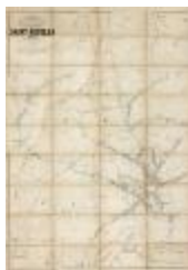
Popp-kaart: Kadastraal plan Sint-Niklaas, Popp 1/5000 (SASN20120510_007)