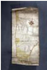
Uittreksel uit ongekend kaartboek van Haasdonk (_88D9698 kopie)