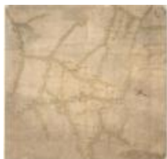
Oorlogsk kaart, Sint-Gillis-Waas (K 542)