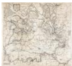
Caerte figurative van 't lant van Waes ende Hulster Ambacht (BWK&P_20120415_113)