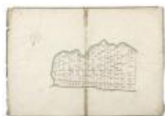
Perseelkaart Schausselbroeck Oosteynde (210)