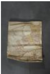
Uittreksel uit ongekend kaartboek van Haasdonk (_88D9686 kopie)