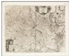
Flandria partes duae quarum altera proprietaria altera imperialis vulgo dicitur (BWK&P_20110101_111)