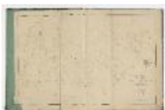
Kadastrale atlas Sinaai, midden 19de eeuw (SASN20120510_005)