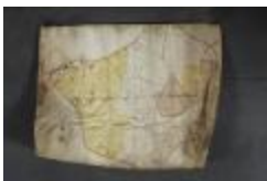
Uittreksel uit een ongekend kaartboek van Haasdonk (_88D9690 kopie)