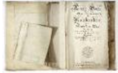
Kaartboek Nieuwkerken, met wijkkarten, 1726 (SASN20120510_011)