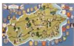
Toeristische kaart van het Waasland (BWK&P_20110101_061)