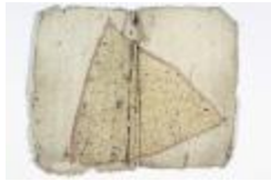
Kaartboek Sint-Niklaas, met wijkkarten, 1696 (SASN20120510_012)