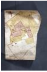
Uittreksel uit ongekend kaartboek van Haasdonk (_88D9692 kopie)