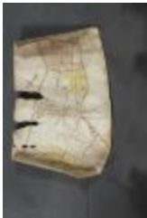
Uittreksel uit ongekend kaartboek van de regio Beveren (_88D9685 kopie)