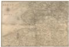
Kaart van Zeeland en de Scheldemonding (Zelande_Escaut A4)