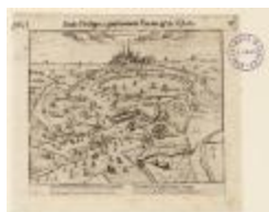
Antverpia sous Philippe 2, gouvernant Parme et les Estats (BWK&P_20110101_094)