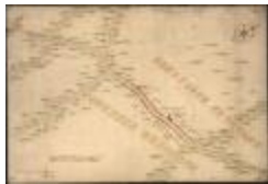
Oorlogskaart: Stekene (Stekene_dorp A4 248/257)