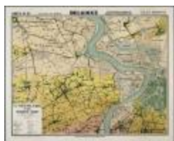
Type du pays de Waes et des polders de l'Escaut (BWK&P_20110101_092)