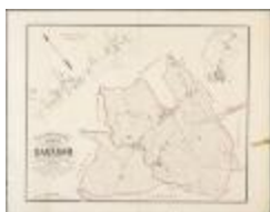
Popp-kaart: Plan parcellaire de la commune de Dacknam avec les mutations (BWK&P_20110101_099)