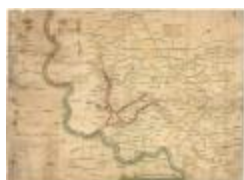
Oorlogskaart, Lokeren (K 483)