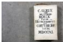
Landboek van Kruibeke (Landboek_Kruibeke)