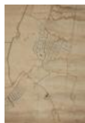
Figuratieve kaart Vrasene, 1767 (SASN20120510_009)