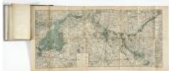
Springtij van 1906 in het bekken van de Schelde (BWK&P_20120421_126)