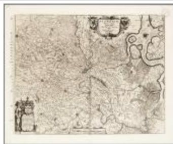
Flandria partes duae quarum altera propriitaria altera imperialis vulgo dicitur (BWK&P_20110101_111)