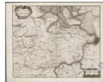
Wasia - 't Land van Waes (BWK&P_20110101_093)