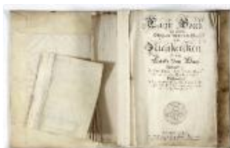
Kaartboek Nieuwkerken, met wijkkaarten, 1726 (SASN20120510_011)