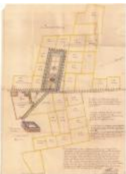
Wijkaart van wijken Kloosterland en Beenaert (Cloosterlant Wijk A4 256/257)