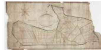
Polderkaart van de dijke van Kallo (K 547)