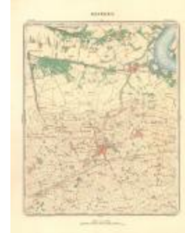
Dépot de la Guerre: Beveren (Beveren A4)