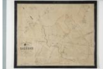
Popp-kaart: Kadasterplan van de gemeente Daknam (1619bis)