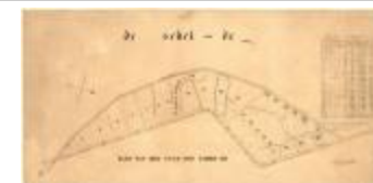
Perceelkaart van het Paardenschor (Paarden schorre A4)