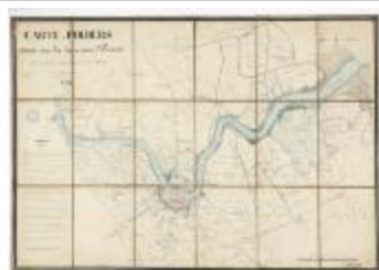
Carte des Polders (BWK&P_20110101_97)