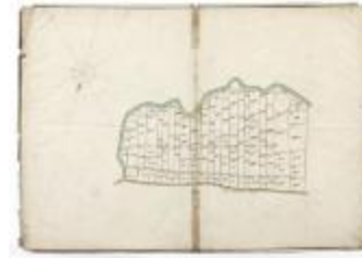
Perseelkaart Schaussebroeck Oosteynde (210)