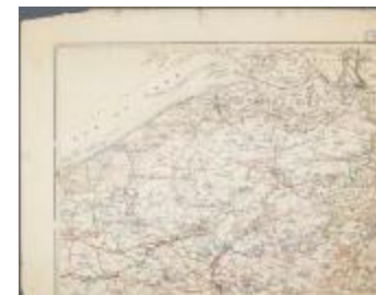
Het graafschap Vlaanderen (BWK&P_20110101_109)