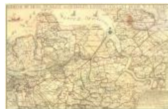
W.T. Hattinga, de Schelde bij Lillo en naast aangelegen landen (Lillo_Hattinga A4)