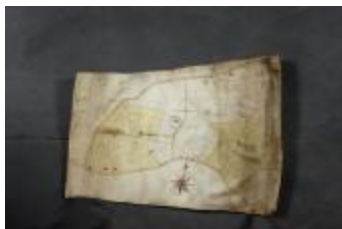
Uittreksel uit ongekend kaartboek van Haasdonk (_88D9691 kopie)