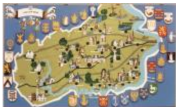
Toeristische kaart van het Waasland (BWK&P_20110101_061)