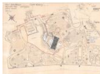
Reynaertspel 1985, technisch plan stadspark (SASN20110512_049)