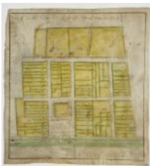
Kaart van Doeldorp (G51)