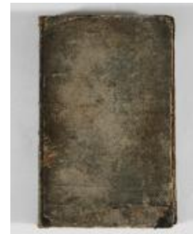
Kaartboek Sint-Gillis-Waas (KOKW) Kaartboek Sint-Gillis-Waas Du Caju