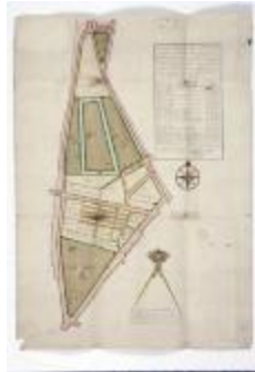
Figuratieve kaart markt Sint-Niklaas, 1765 (SASN20120510_002)