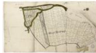
Vierden brouckwijk (Bazel) (BWK&P_20120417_002)