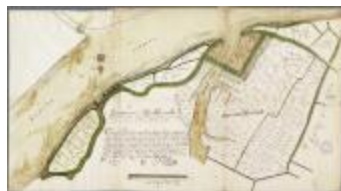
Caerten figurative van alle landen gelegen in Baesel ende Rupelmonde Broeck... (BWK&P_20110101_103)