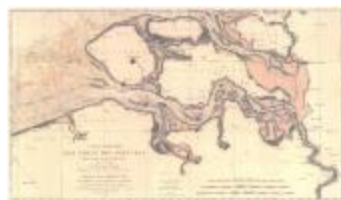
Carte réduite des cotes des Pays-Bas (Côte des Pays-Bas A4)