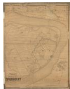
Popp-kaart: Zwijndrecht (Zwijndrecht_Popp A4)