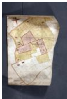
Uittreksel uit ongekend kaartboek van Haasdonk (_88D9692 kopie)