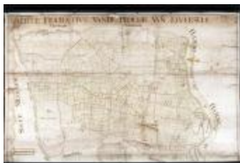
Figuratieve kaart van Elversele, 1716 (_88D5734 kopie)