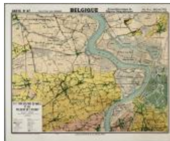
Type du pays de Waes et des polders de l'Escaut (BWK&P_20110101_092)