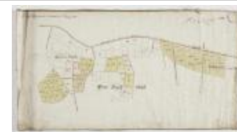
Figuratieve Caerte van de Cabbeljou Thiende (K 474)