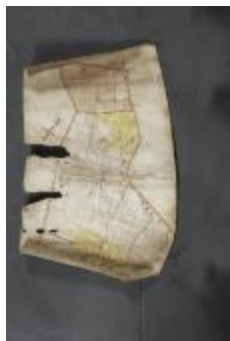
Uittreksel uit ongekend kaartboek van de regio Beveren (_88D9685 kopie)