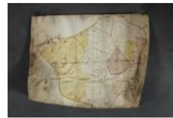
Uittreksel uit een ongekend kaartboek van Haasdonk (_88D9690 kopie)