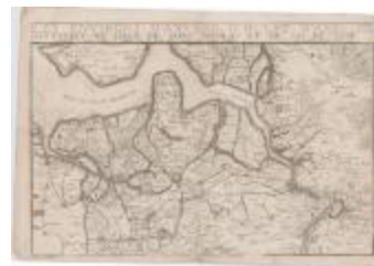
Les environs d'Anvers, d'Hulst, d'Axel, de Santvliet, de Lillo, de Saint-Nicolas et du Sas de Gand (Danet)