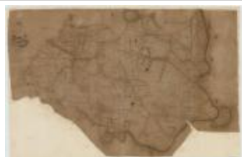
Fricx, Carte très particulière du Pays de Waes (Tres particuliere)