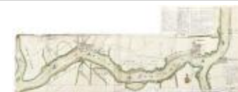
De Schelde met aangrenzende gronden, 1747 (_88D5713 kopie)