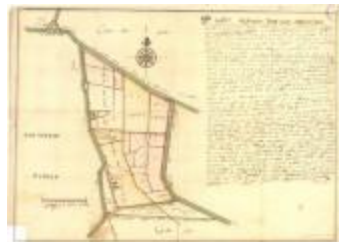
Perceelkaart van de regio Arenbergpolder (K 588)