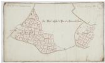
Wijkaart van Haasdonk, omgeving Perstraat en Botermelkstraat (K 475)