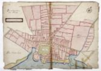
Dorp Temse met dorpsnummers (192)