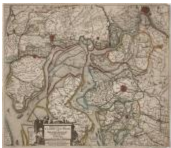
Detail uit Visscher, Nieuwe kaerte van 't Landt van Waes (K 291)