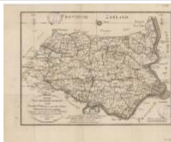
Overzichtskaart van district Sint-Niklaas (K 471)