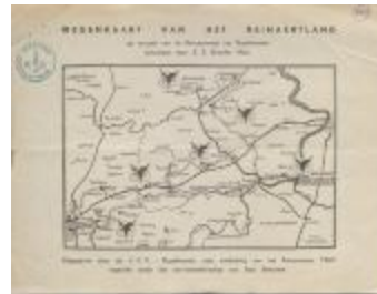
Wegenkaart van het Reinaertland (BWMAP19_20101021_021)