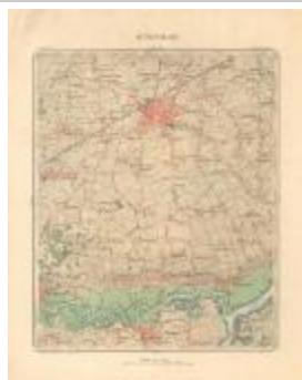
Dépot de la Guerre, Saint-Nicolas (St- Nicolas A4)