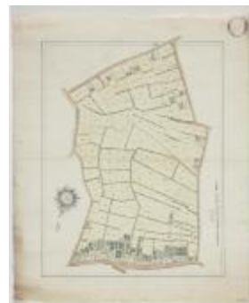
Wijkaart Borchtmeulenakker, Stekene (K 452)