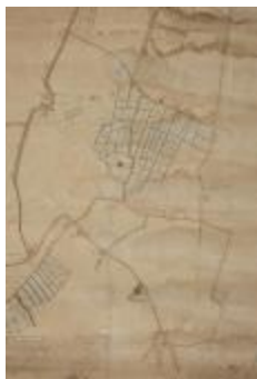
Figuratieve kaart Vrasene, 1767 (SASN20120510_009)