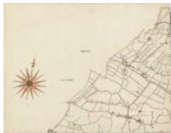
Kaerte figurative van het land van Waes (BWK&P_20110101_091)