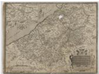
Ortelius, Kaart van Vlaanderen (K 559)