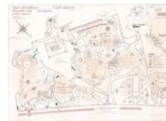
Reynaertspel 1992, technisch plan stadspark (SASN20110512_050)