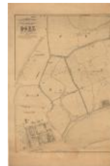
Popp-kaart: Atlas cadastral de Belgique - Commune de DOEL (Doel_Popp A4)