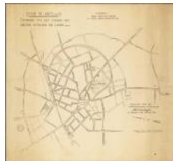
Stad Sint-Niklaas: ontwerp tot het openen van nieuwe straten en lanen (BWK&P_20110101_104)