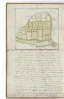
Perceelkaart Meulenbroeck (210bis)