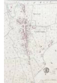
Kadastraal plan Belsele, detailopname dorpskern (SASN20120510_004)