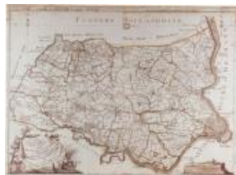
J.B. de Bouge, Carte Topographique du Pays de Waes (K 373)