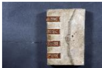
Landboek van Melsele (GAB20122522_001)