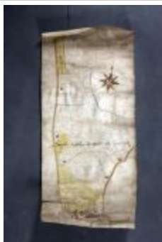
Uittreksel uit ongekend kaartboek van Haasdonk (_88D9698 kopie)