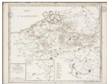
Carte du Hainaut, Flandre, Brabant, Luxembourg et Païs de Limbourg (BWK&P_20110101_107)