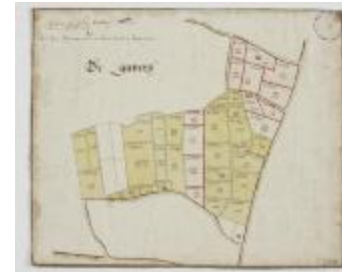
Wijkaart van Haasdonk, omgeving De Gavers (K 478)