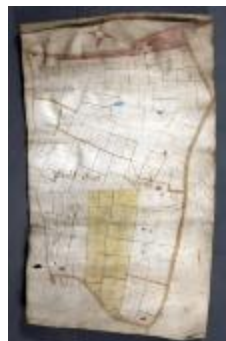
Uittreksel uit ongekend kaartboek van Haasdonk (_88D9694 kopie)