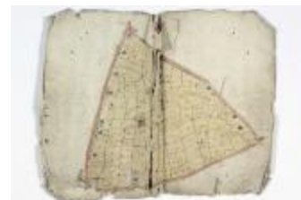
Kaartboek Sint-Niklaas, met wijkkaarten, 1696 (SASN20120510_012)