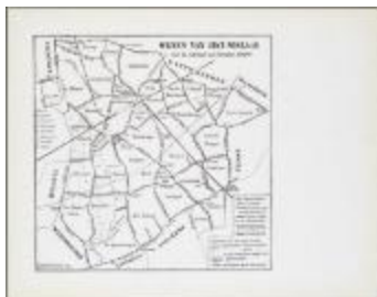
Wijken van Sint-Niklaas naar de oude kaart van Semeelen (BWK&P_20110101_106)