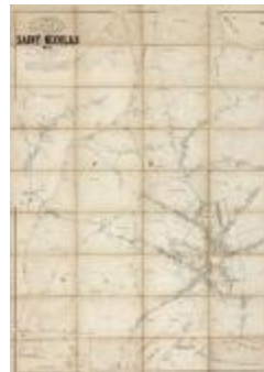
Popp-kaart: Kadastraal plan Sint-Niklaas, Popp 1/5000 (SASN20120510_007)