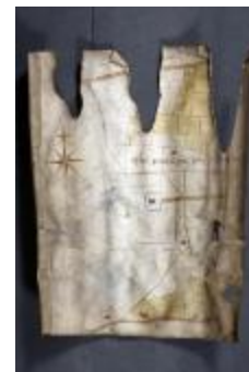
Uittreksel uit ongekend kaartboek van Haasdonk (_88D9696 kopie)