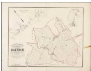
Popp-kaart: Plan parcellaire de la commune de Dacknam avec les mutations (BWK&P_20110101_099)