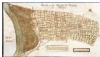
Figuratieve kaart van de heerlijkheid van Cauwerburgh (GAT20120521_001)