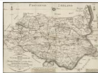
Nieuwe plaatsbeschrijfkundige kaart van het distrikt Sint-Nikolaas voorheen Land van Waas (BWK&P_20110101_112)