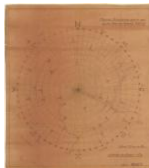
Oriëntering vanop de toren van Temse (Oriëntering_toren_Temsche A4)