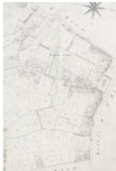
Kadastraal plan Sinaai, detailopname dorpskern (SASN20120510_006)