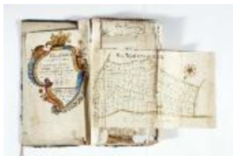
Kaartboek Stekene (KOKW Kaartboek Stekene Vergouwen)