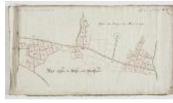
Wijkaart regio Haasdonk (Zandstraat) en Melsele (K 477)