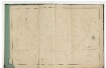
Kadastrale atlas Sinaai, midden 19de eeuw (SASN20120510_005)