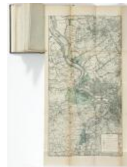
Springtij van 1906 in het Scheldebekken (BWK&P_20120421_121)