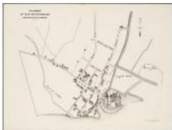
Fragment du plan de Rupelmonde (BWK&P_20110101_102)