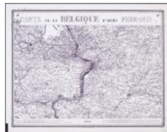
Carte de Belgique d'après Ferraris (BWK&P_20110101_108)