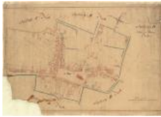
Kadastrale kaart van Beveren (Beveren_SectionD_8eFeuille)