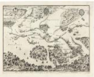
Het belegg der stadt Antwerpen (BWK&P_20120415_115)