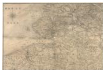
Kaart van Zeeland en de Scheldemonding (Zelande_Escaut A4)