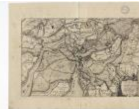
Caerte van 't Scheldt ende Santvliet (BWK&P_20120417_116)