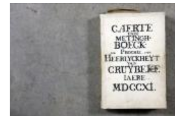
Landboek van Kruibeke (Landboek_Kruibeke)