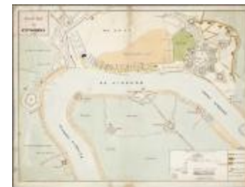
Positie van Antwerpen (BWK&P_20110101_098)