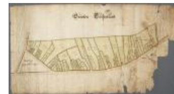
Grooten Clooserlant (BWK&P_20110101_105)