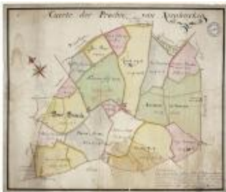
Caerte der prochie van Nieuwerkerken (BWK&P_20120415_114)