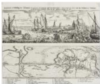
De Slag van Kallo (Liefkenshoek 2006.01.14)