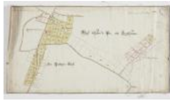
Wijkaart van Haadonk, omgeving Ropstraat en Bergstraat (K 476)