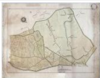
Wijkaart Stekene: Hellestraat-Kapellebrug (K 463)