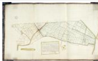
Caertien figuratief van de hooghe landen opde Waessche Clinghe (BWK&P_20110101_100)