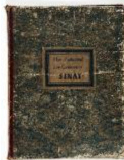
Plan Cadastral der Gemeente Sinay (KOKW Plan Cadastral Sinaai)