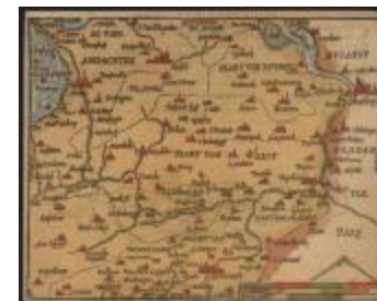
De Charte van Vlaenderen (Het Land van Waas_Heyns A4)