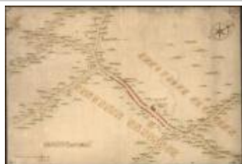
Oorlogskaat: Stekene (Stekene_dorp A4 248/257)