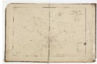
Kadastrale atlas Belsele, 1856 (SASN20120510_003)