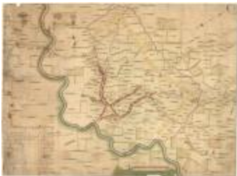
Oorlogskaat, Lokeren (K 483)