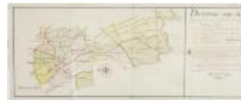
Figuratieve geaquarelleerde kaart van de kasseiwegen te Sint-Niklaas (Keure226)