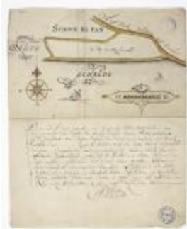
Kaart van een schor nabij Bazel (BWK&P_20120421_135)