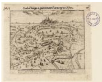
Antverpia sous Philippe 2, gouvernant Parme et les Estats (BWK&P_20110101_094)