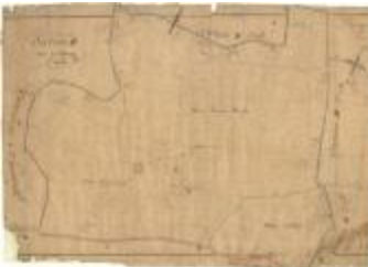
Kadastrale kaart van Beveren (Beveren_SectionD_3eFeuille)