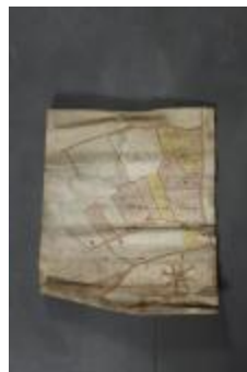
Uittreksel uit ongekend kaartboek van Haasdonk (_88D9686 kopie)