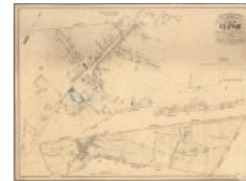
Popp-kaart: Clinge (Clinge_Popp A4)