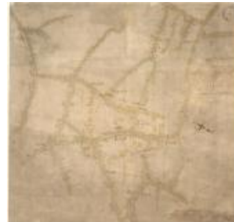
Oorlogskaat, Sint-Gillis-Waas (K 542)