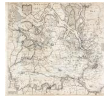
Caerte figurative van 't lant van Waes ende Hulster Ambacht (BWK&P_20120415_113)