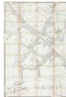
Popp-kaart: Kadastraal plan Sint-Niklaas, Popp 1/2500 (SASN20120510_008)