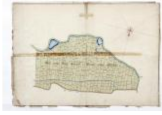
Perceelkaart Schaussebroeck Westeynde (209)