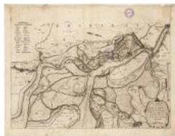
Tabula castelli ad Santflitam,... (BWK&P_20110101_095)