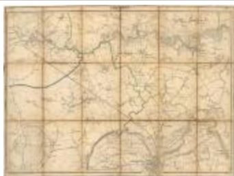
Vandermaelen: Lokeren en Dendermonde (Lokeren_Termonde A4)