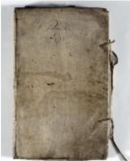
Kaartboek Sint-Pauwels (KOKW Kaartboek Sint-Pauwels Maes)