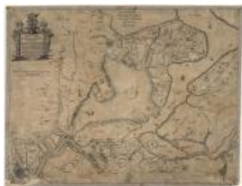
Description de Santvliet, la Rivière Schelde et Pais de Hulst (Santvliet-Hulst A4 253/257)