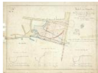
Kasteel van Temsche (BWK&P_20120417_117)