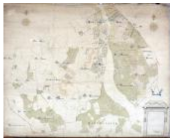
Kaart van heerlijkheden het Beverse, Puiembeke, Paddeschoot en Aarschot te Sint-Niklaas, 1786 (SASN20120510_010)