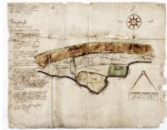
Polderkaart: Aanwassen verloren Cost 1659 (212bisb)