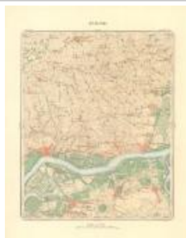
Dépot de la Guerre: Tamise (Tamise A4 227/257)