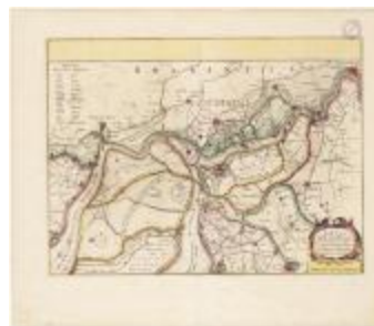
Tabula castelli ad Santflitam,... (BWK&P_20110101_096)