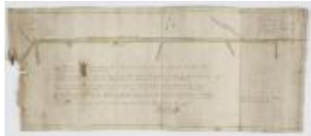
Kaart van grensscheiding Sint-Niklaas en Temse, 1750 (SASN20120510_001)