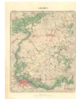
Dépot de la Guerre: Lokeren (Lokeren A4)