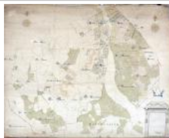
Kaart van heerlijkheden het Beverse, Puiembeke, Paddeschoot en Aarschot te Sint-Niklaas, 1786 (SASN20120510_010)