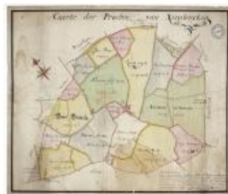
Caerte der prochie van Nieuwerkerken (BWK&P_20120415_114)