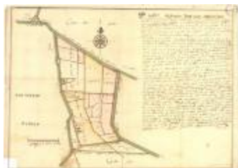
Perceelkaart van de regio Arenbergpolder (K 588)