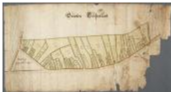
Grooten Clooserlant (BWK&P_20110101_105)