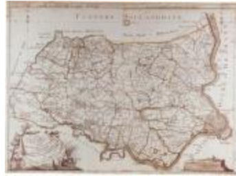
J.B. de Bouge, Carte Topographique du Pays de Waes (K 373)