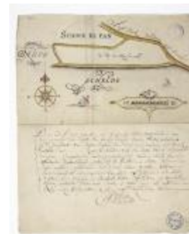
Kaart van een schor nabij Bazel (BWK&P_20120421_135)