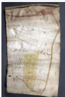
Uittreksel uit ongekend kaartboek van Haasdonk (_88D9694 kopie)