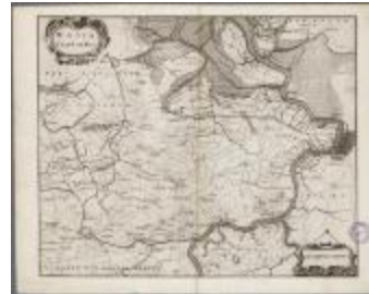
Wasia - 't Land van Waes (BWK&P_20110101_093)