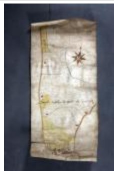
Uittreksel uit ongekend kaartboek van Haasdonk (_88D9698 kopie)