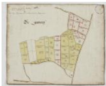
Wijkkaart van Haasdonk, omgeving De Gavers (K 478)