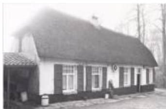
Hoeve te Temse (WAS001000044)