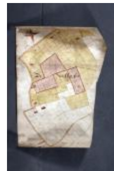
Uittreksel uit ongekend kaartboek van Haasdonk (_88D9692 kopie)