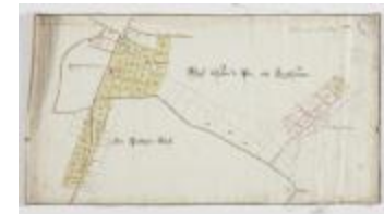
Wijkaart van Haasdonk, omgeving Ropstraat en Bergstraat (K 476)