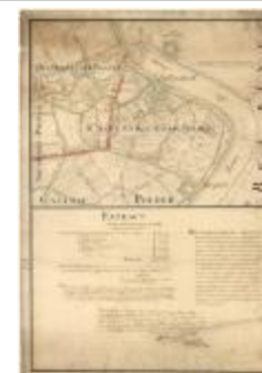
Polders van Kallo, Sint-Anna Ketenisse, Doel en Arenberg (Liefkenshoek A4)