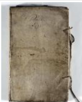
Kaartboek Sint-Pauwels (KOKW Kaartboek Sint-Pauwels Maes)