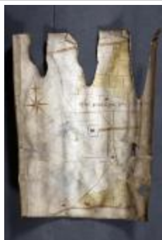
Uittreksel uit ongekend kaartboek van Haasdonk (_88D9696 kopie)