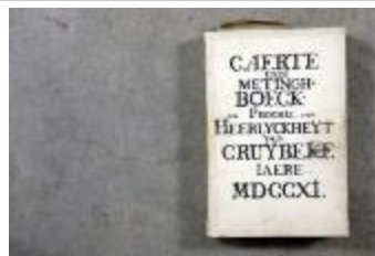
Landboek van Kruikebe (Landboek_Kruikebe)