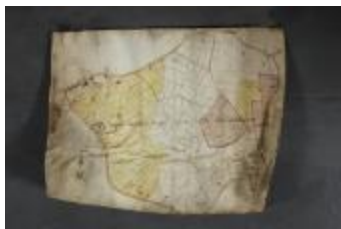
Uittreksel uit een ongekend kaartboek van Haasdonk (_88D9690 kopie)