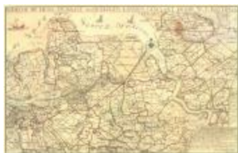
W.T. Hattinga, de Schelde bij Lillo en naast aangelegen landen (Lillo_Hattinga A4)