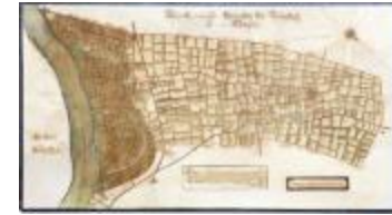
Figuratieve kaart van de heerlijkheid van Cauwerburgh (GAT20120521_001)