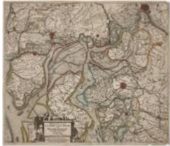
Detail uit Visscher, Nieuwe kaerte van 't Landt van Waes (K 291)