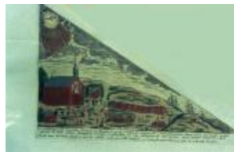
Bedevaartvaantje Sint-Cornelis (PCPP20110912001)