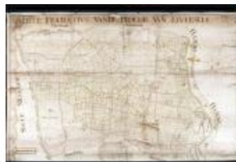
Figuratieve kaart van Elversele, 1716 (_88D5734 kopie)