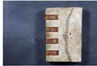
Landboek van Melsele (GAB20122522_001)