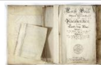
Kaartboek Nieuwerkerken, met wijkkaarten, 1726 (SASN20120510_011)