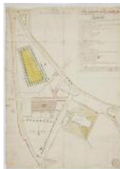
De markt en het centrum van Sint-Niklaas (K 508)