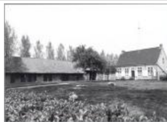
Hoeve uit 1780, Sinaai (WAS001000007)