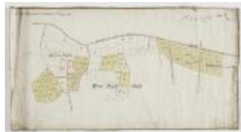
Figuratieve Caerte van de Cabbeljau Thiende (K 474)