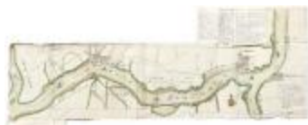
De Schelde met aangrenzende gronden, 1747 (_88D5713 kopie)