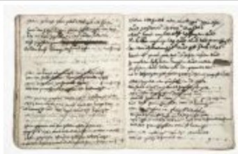
Journal van inkomsten en uitgaven (schenking2005.01)