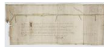
Kaart van grensscheiding Sint-Niklaas en Temse, 1750 (SASN20120510_001)