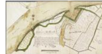
Caerten figurative van alle landen gelegen in Baesel ende Rupelmonde Broeck... (BWK&P_20110101_103)