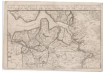
Les environs d'Anvers, d'Hulst, d'Axel, de Santvliet, de Lillo, de Saint-Nicolas et du Sas de Gand (Danet)