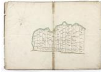
Perseelkaart Schausselbroeck Oosteynde (210)