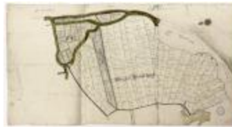
Vierden brouckwijk (Bazel) (BWK&P_20120417_002)