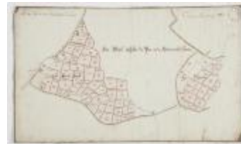
Wijkaart van Haasdonk, omgeving Perstraat en Botermelkstraat (K 475)