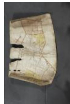
Uittreksel uit ongekend kaartboek van de regio Beveren (_88D9685 kopie)