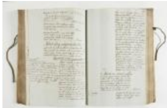
Register van staten van goed van de heerlijkheid Eksaarde. (320)