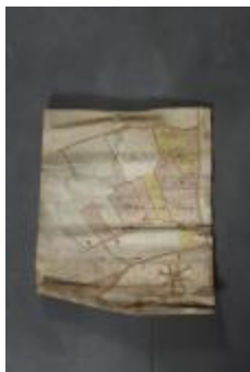
Uittreksel uit ongekend kaartboek van Haasdonk (_88D9686 kopie)