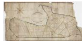
Polderkaart van de dijke van Kallo (K 547)