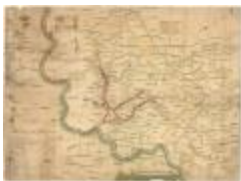
Oorlogskaart, Lokeren (K 483)