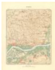
Dépot de la Guerre: Tamise (Tamise A4 227/257)