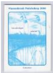
Vlassenbroek Poëziedorp 2000 (PCAV20121103_001)