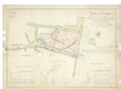
Kasteel van Temsche (BWK&P_20120417_117)