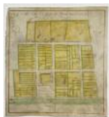
Kaart van Doeldorp (G51)