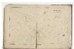
Kadastrale atlas Belsele, 1856 (SASN20120510_003)