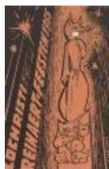
Programmabrochure Reinaertfeesten Lochristi (BWMAP19_20101021_026)