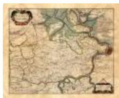
WASIA 't Land van Waes (PCEH20120320_016)