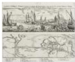
De Slag van Kallo (Liefkenshoek 2006.01.14)