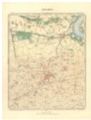
Dépot de la Guerre: Beveren (Beveren A4)