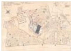
Reynaertspel 1985, technisch plan stadspark (SASN20110512_049)