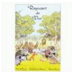
Stripverhaal Reynaert de Vos (BWMAP19_20100401_001)