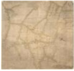
Oorlogskaart, Sint-Gillis-Waas (K 542)