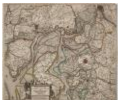
Detail uit Visscher, Nieuwe kaerte van 't Landt van Waes (K 291)