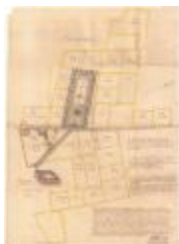
Wijckkaart van wijken Kloosterland en Beenaert (Cloosterlant Wijck A4 256/257)