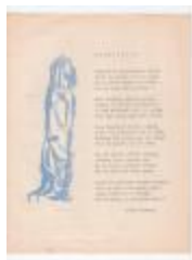
Anton Vlaskop schreef in 1962 een paasliedje (PCAV20130401_01)