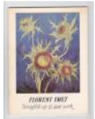
Florent Smet : Terugblik op 35 jaar werk 1979 (PCAV20121227_001)