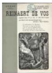
Programmabrochure éénmanstoneel Reynaert de Vos (BWMAP19_20101021_023)