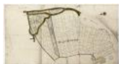
Vierden brouckwijck (Bazel) (BWK&P_20120417_002)