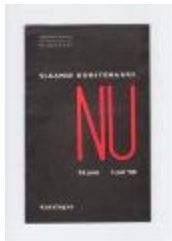
Vlaams Kunstenaars Nu 24 juni - 3 juli 1966: Anton Vlaskop (PCAV20121231_001)