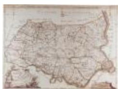
J.B. de Bouge, Carte Topographique du Pays de Waes (K 373)