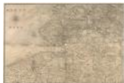
Kaart van Zeeland en de Scheldemonding (Zelande_Escaut A4)