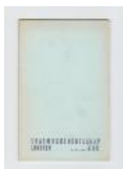
Anton Vlaskop en het Erasmusgenootschap Lokeren (pcav20131003_001)