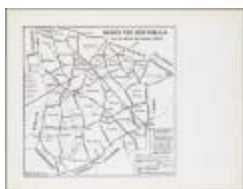
Wijken van Sint-Niklaas naar de oude kaart van Semeelen (BWK&P_20110101_106)