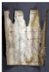
Uittreksel uit ongekend kaartboek van Haasdonk (_88D9696 kopie)