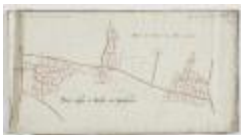
Wijkkkaart regio Haasdonk (Zandstraat) en Melsele (K 477)