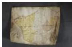
Uittreksel uit een ongekend kaartboek van Haasdonk (_88D9690 kopie)