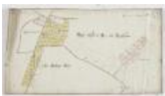
Wijkkkaart van Haasdonk, omgeving Ropstraat en Bergstraat (K 476)