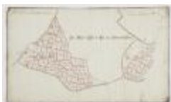
Wijkkkaart van Haasdonk, omgeving Perstraat en Botermelkstraat (K 475)