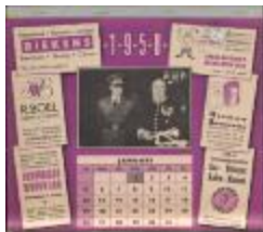
Kalender voor 1958 met foto's Koninklijke bezoeken (BWMAP227_20101021_041)