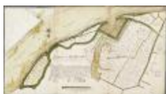
Caerten figurative van alle landen gelegen in Baesel ende Rupelmonde Broeck... (BWK&P_20110101_103)