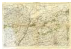
Lokeren (Watervliet) (PCEH20120320_08)