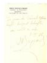
Verzoek huisarts (ERF010511-074)