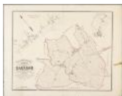
Popp-kaart: Plan parcellaire de la commune de Dacknam avec les mutations (BWK&P_20110101_099)