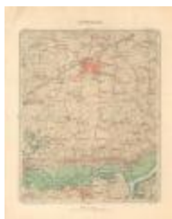
Dépot de la Guerre, Saint-Nicolas (St-Nicolas A4)