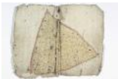
Kaartboek Sint-Niklaas, met wijkkaarten, 1696 (SASN20120510_012)