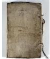
Kaartboek Sint-Pauwels (KOKW Kaartboek Sint-Pauwels Maes)