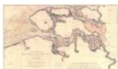
Carte réduite des cotes des Pays-Bas (Côtes des Pays-Bas A4)