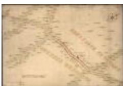
Oorlogskaart: Stekene (Stekene_dorp A4 248/257)