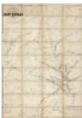
Popp-kaart: Kadastraal plan Sint-Niklaas, Popp 1/5000 (SASN20120510_007)