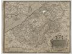
Ortelius, Kaart van Vlaanderen (K 559)