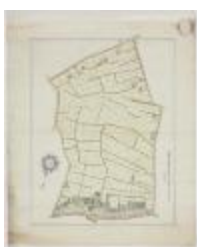
Wijkaart Bormtmeulenakker, Stekene (K 452)