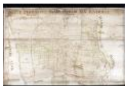
Figuratieve kaart van Elversele, 1716 (_88D5734 kopie)