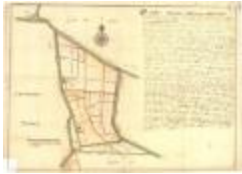
Perceelkaart van de regio Arenbergpolder (K 588)