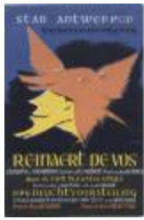
Openluchtvoorstelling Reinaert de Vos (BWMAP19_20101021_028)