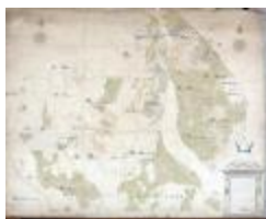
Kaart van heerlijkheden het Beverse, Puiembeke, Paddeschoot en Aarschot te Sint-Niklaas, 1786 (SASN20120510_010)