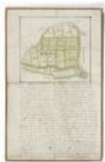
Perceelkaart Meulenbroeck (210bis)