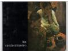
Lea Vanderstraeten en Anton Vlaskop (PCAV20121228_001)