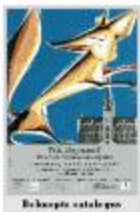
Beknopte catalogus 'Wij, Reynaert!' (WAS20110525_001)