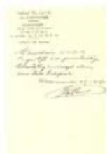
Verzoek huisarts (ERF010511-073)