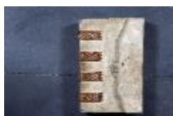
Landboek van Melsele (GAB20122522_001)