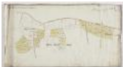
Figuratieve Caerte van de Cabbeljau Thiende (K 474)