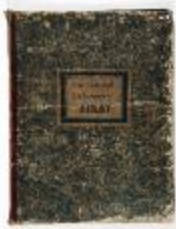
Plan Cadastral der Gemeente Sinay (KOKW Plan Cadastral Sinaai)