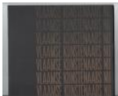
Vlaamse Kunstenaars nu 23 juni - 9 juli '67: Anton Vlaskop (PCAV20121111_007)