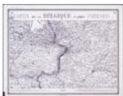
Carte de Belgique d'après Ferraris (BWK&P_20110101_108)