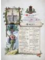
Menukaart inhuldiging nieuw stadhuis, 1 september 1878 (SASN20101119_008)