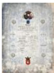
Banket koninklijk bezoek Sint-Niklaas, 17 september 1865 (SASN20101119_004)