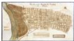
Figuratieve kaart van de heerlijkheid van Cauwerburgh (GAT20120521_001)