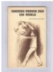
Anton Vlaskop in KINDEREN DROMEN ZICH EEN WERELD (PCAV15112014)