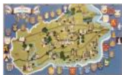
Toeristische kaart van het Waasland (BWK&P_20110101_061)