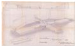
Reynaertspel 1973, technisch plan podium Grote Markt (SASN20110512_048)