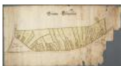
Grooten Clooserlant (BWK&P_20110101_105)