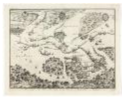
Het beleggh der stadt Antwerpen (BWK&P_20120415_115)