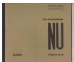
Het Zelfportret Nu : Samensteller en layout Anton Vlaskop (PCAV20121202_001)