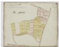
Wijkkkaart van Haasdonk, omgeving De Gavers (K 478)