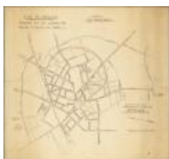
Stad Sint-Niklaas: ontwerp tot het openen van nieuwe straten en lanen (BWK&P_20110101_104)