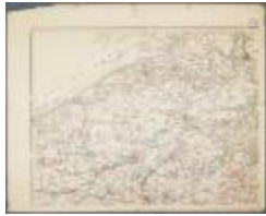
Het graafschap Vlaanderen (BWK&P_20110101_109)