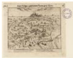
Antverpia sous Philippe 2, gouvernant Parme et les Estats (BWK&P_20110101_094)