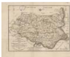
Overzichtskaart van district Sint-Niklaas (K 471)