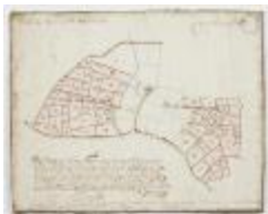
Figuratieve Caerte van de Cabbeljau Thiende (K 473)