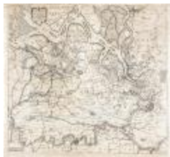
Caerte figurative van 't lant van Waes ende Hulster Ambacht (BWK&P_20120415_113)