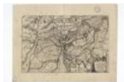
Caerte van 't Scheldt ende Santvliet (BWK&P_20120417_116)