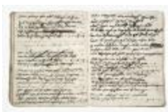
Journal van inkomsten en uitgaven (schenking2005.01)