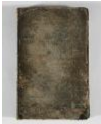
Kaartboek Sint-Gillis-Waas (KOKW Kaartboek Sint-Gillis-Waas Du Caju)