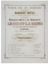
Concert tijdens koninklijk banket stadhuis, 1 september 1878 (SASN20101119_007)