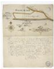
Kaart van een schor nabij Bazel (BWK&P_20120421_135)