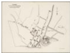
Fragment du plan de Rupelmonde (BWK&P_20110101_102)