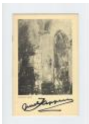
Juul Keppens en Anton Vlaskop (PCAV20130106_001)