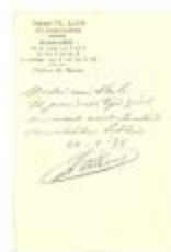
Verzoek huisarts (ERF010511-077)