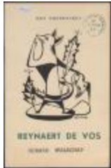
Poppenspel Reynaert de Vos (BWMAP19_20101021_030)