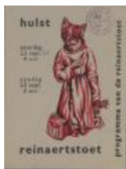
Programma van de Reynaertstoet (BWMAP19_20101021_038)