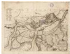
Popp-kaart: Plan parcellaire de la commune de Elversele avec les mutations (BWK&P_20110101_101)