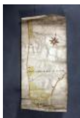
Uittreksel uit ongekend kaartboek van Haasdonk (_88D9698 kopie)